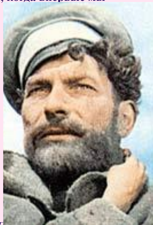
Портрет Петра Мелехова в роли Григория Мелехова из к/ф "Тихий дон" (1957г.)

Уже портретная характеристика, соотнесенная с только что поведанной историей его деда Прокофия, создает впечатление о человеке ярком, по-юношески порывистом и неукротимом.