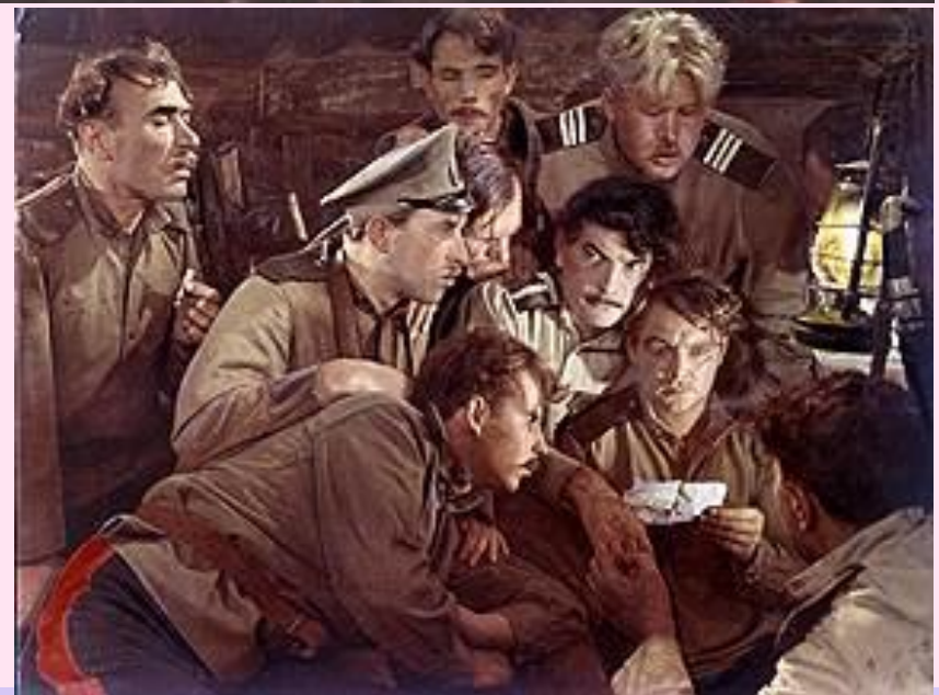
Кадры из к/ф "Тихий дон» (1957г.)