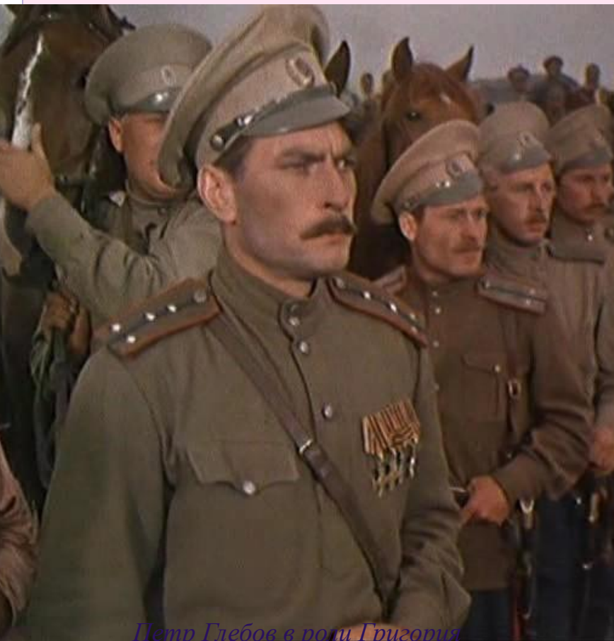
Петр Глебов в роли Григория Мелехова из к/ф "Тихий дон" (1957г.)

Первая Мировая война разрушает всё в сознании Григория. Олодецкая спесь слетает с Григория, когда он видит, как умирают его друзья-казаки: «Первым упал с коня хорунжий Ляховский. На него наскочил Прохор... Резцом, как алмазом на стекле, вырезала память Григория и удержала надолго розовые десны Прохорова коня с шероховатыми плитами зубов, Прохора, упавшего на шашмя, растоптанного копытами скакавшего сзади казака... Пали еще. Казаки пали и кони».