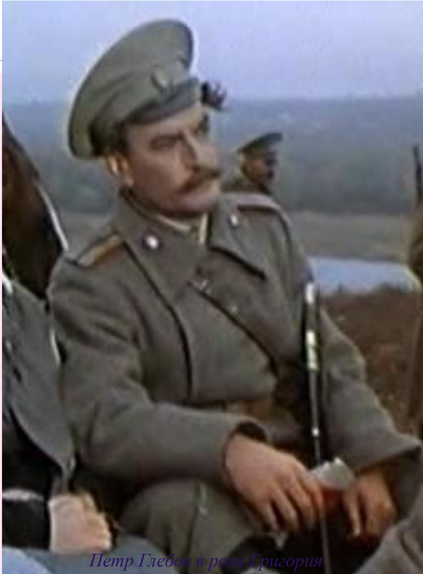
Петр Глебов в роли Григория Мелехова из к/ф "Тихий дон» (1957г.)

Во время революции поиски правды Григорием продолжаются. После спора с Котляровым и Кошевым, где герой заявляет, что пропаганда равенства – лишь приманка, чтобы ловить невежественный народ , Григорий приходит к выводу, что глупо искать единую всеобщую правду. У разных людей – своя разная правда в зависимости от их устремлений.