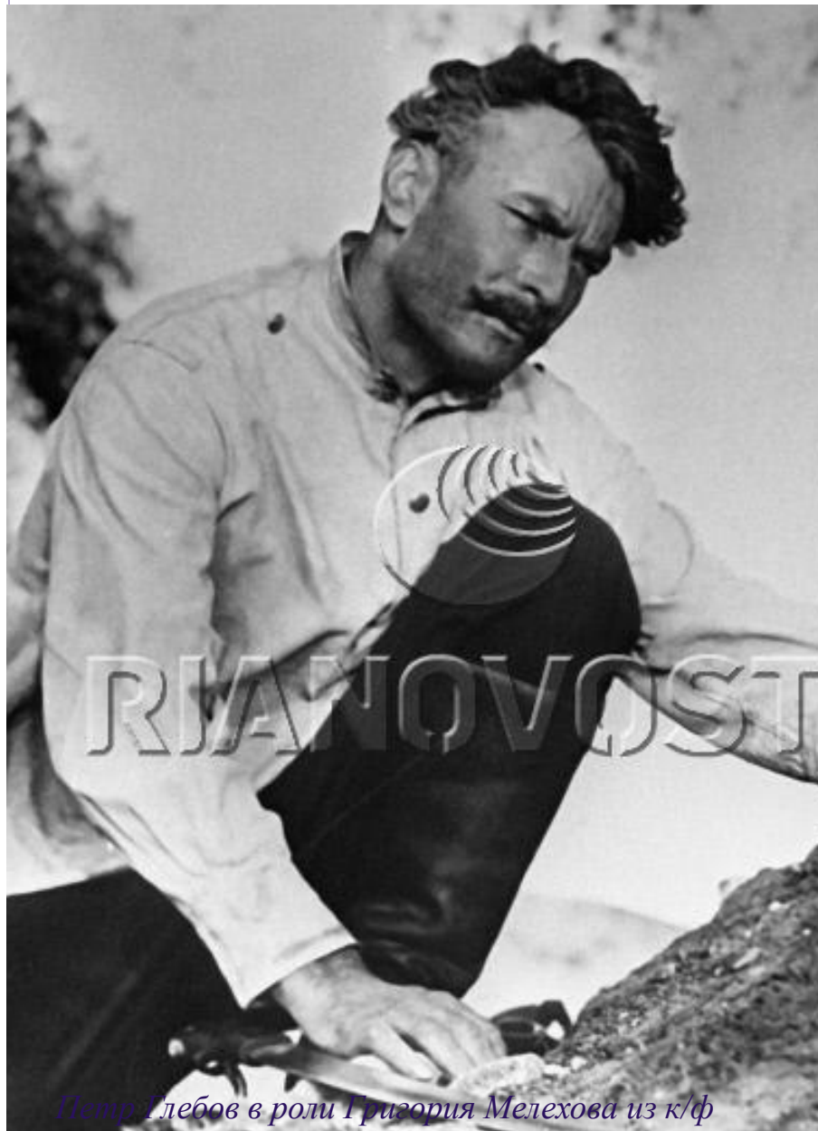
Петр Глебов в роли Григория Мелехова из к/ф "Тихий дон» (1957г.)

Григорий - настоящий, типичный казак, бедовый и честный, каких становится все меньше.