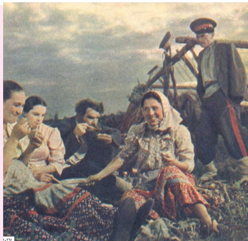
Кадр из к/ф "Тихий дон» (1957г.)

«Хорошо бы взяться руками за чапиги и пойти по влажной борозде за плугом, жадно вбирая ноздрями сырой и пресный запах взрыхленной земли, горький аромат порезанной лемехом травы».