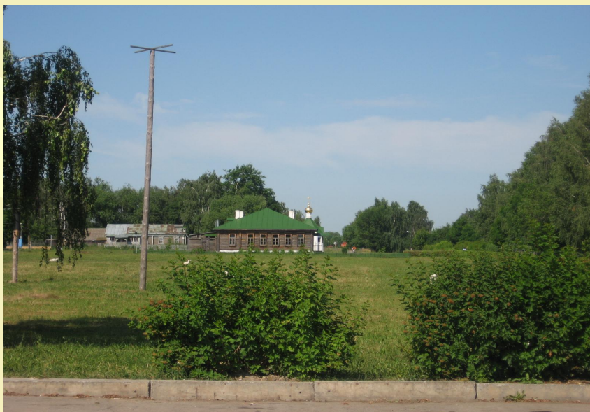
Земская школа, где учился ПОЭТ