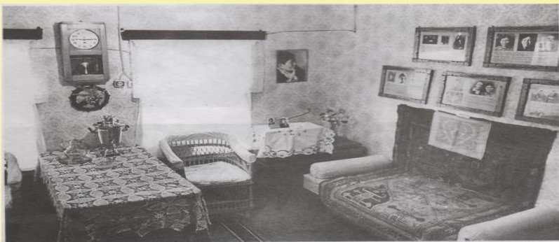
В Доме – музее Ашальчи Оки в селе Алнаш