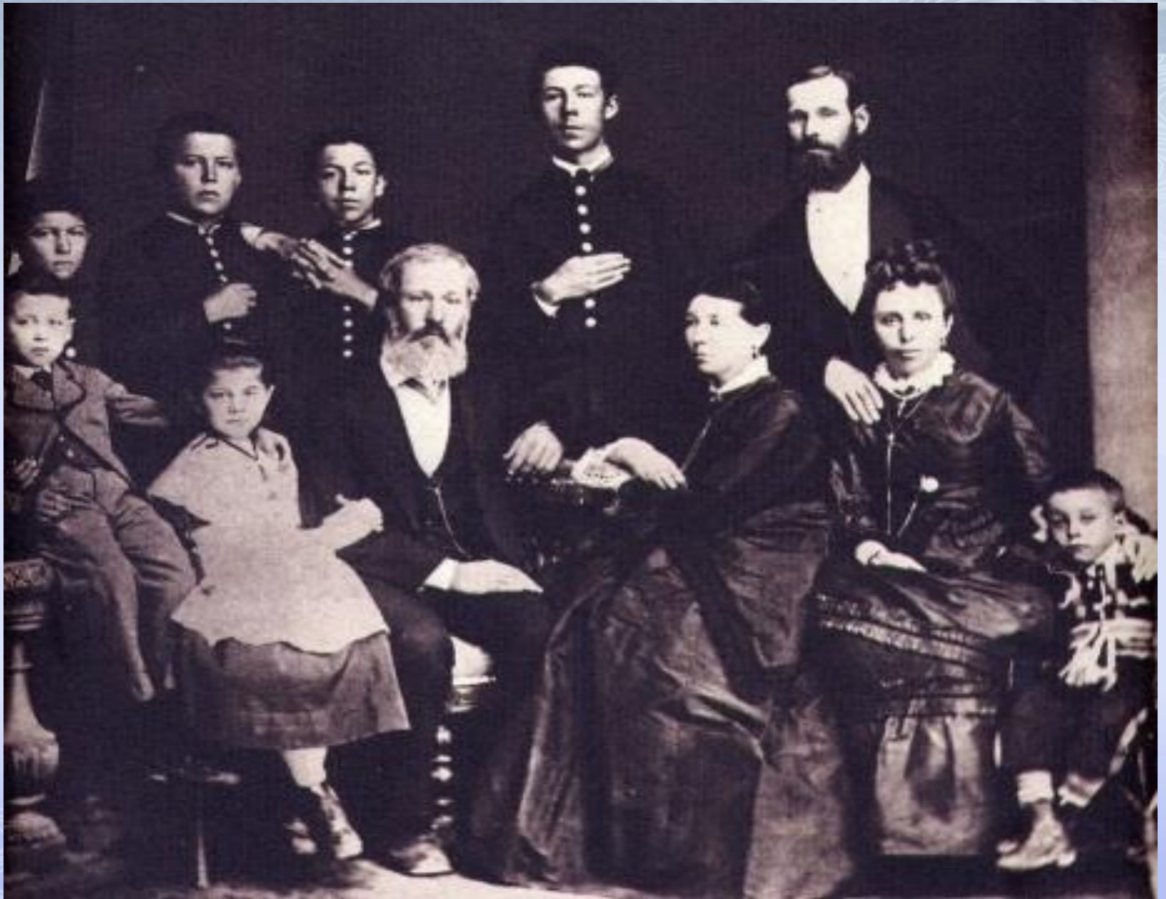
Семья Чеховых. Фото 1874. Таганрог