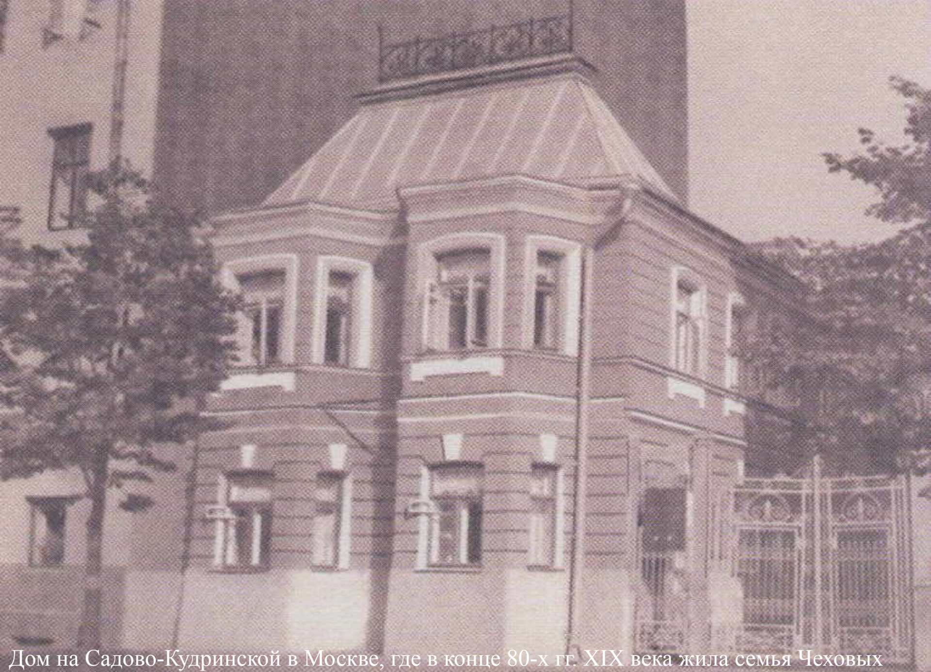
Дом на Садово-Кудринской в Москве, где в конце 80-х гг. XIX века жила семья Чеховых