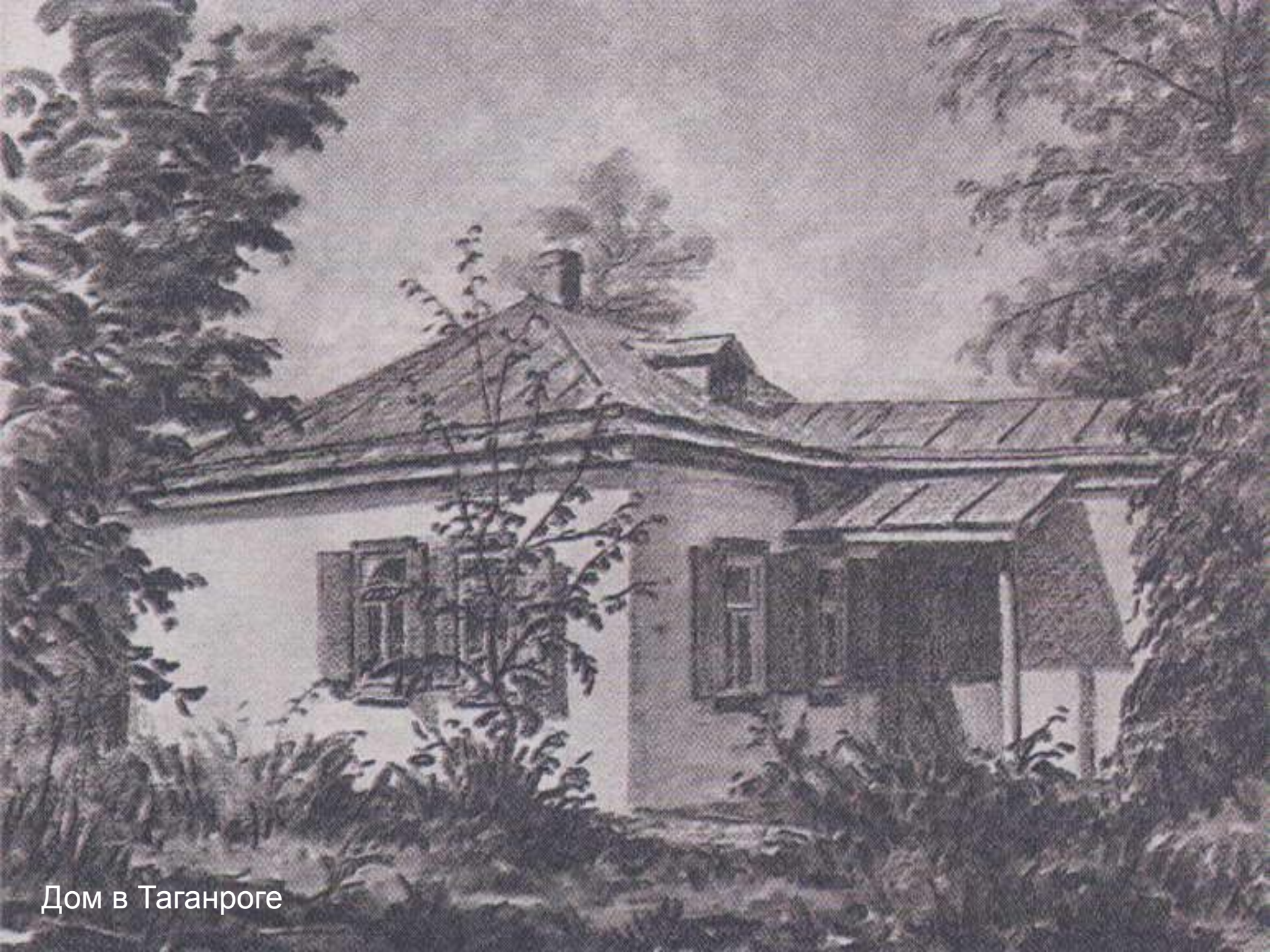
Дом в Таганроге