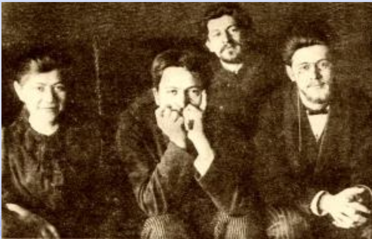
Сестра и братья Чеховы: Мария, Антон, Иван, Михаил. Фото 1892. Мелихово

Природа богато одарила детей Чеховых. Александр и Михаил так же, как и Антон, стали литераторами, Николай — художником, Иван — оставил добрую память, будучи учителем. Мария Павловна , прожившая самую долгую жизнь, была и художницей, и мемуаристкой, создателем и хранителем Музея А. П. Чехова в Ялте.