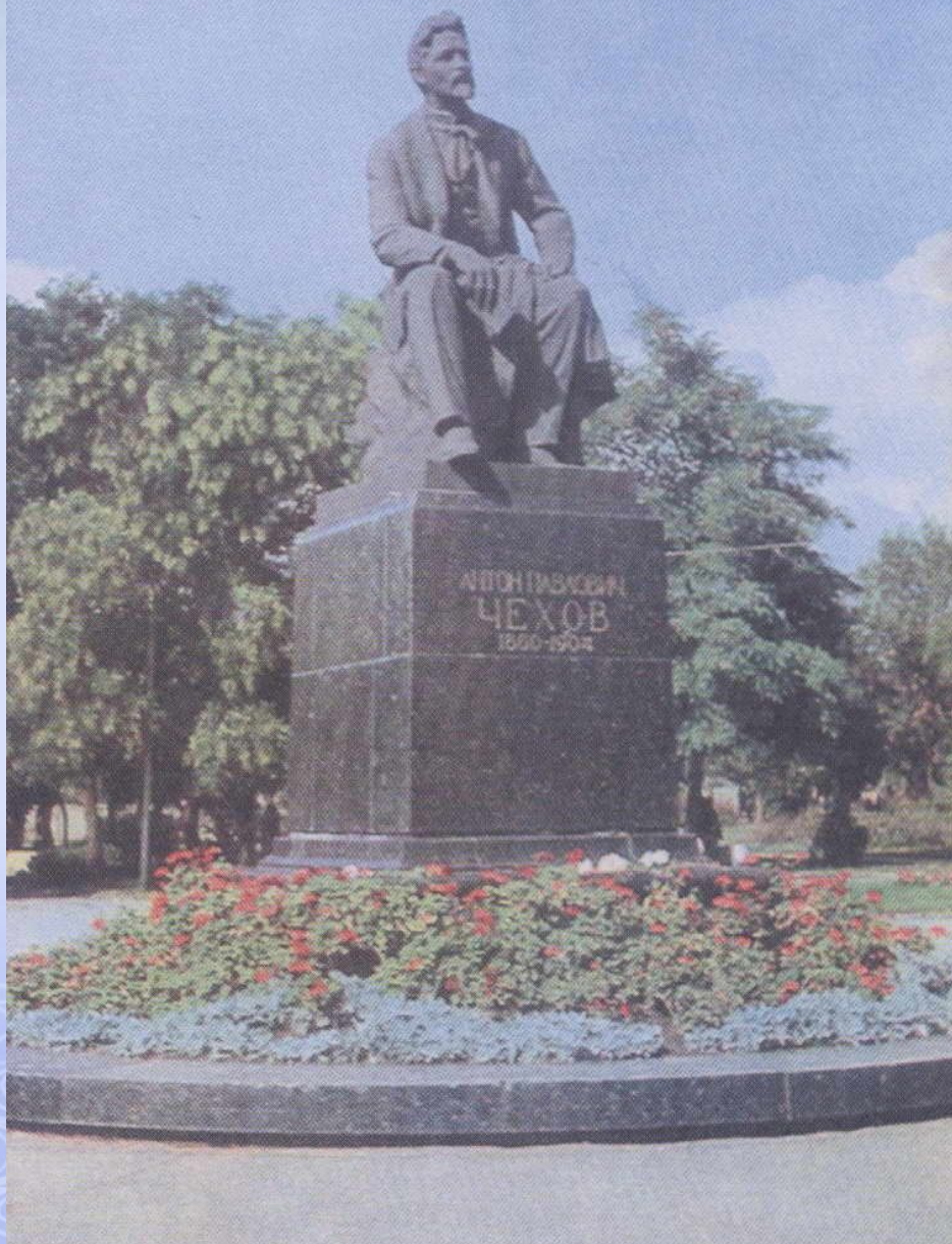
Памятник А.П. Чехову в Таганроге. Скульптор И.М. Рукавишников