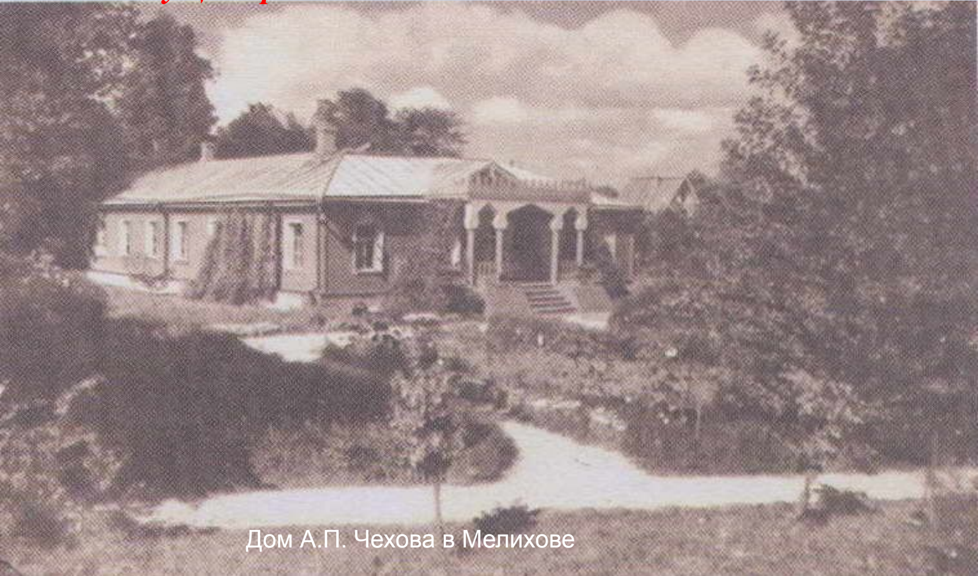
Дом А.П. Чехова в Мелихове

В 1892 году Чехов поселился под Москвой, в деревне Мелихово. Писатель так обосновал свое решение: «Если я врач, то мне нужны больные и больница, если я литератор, то мне нужно жить в гуще народа».