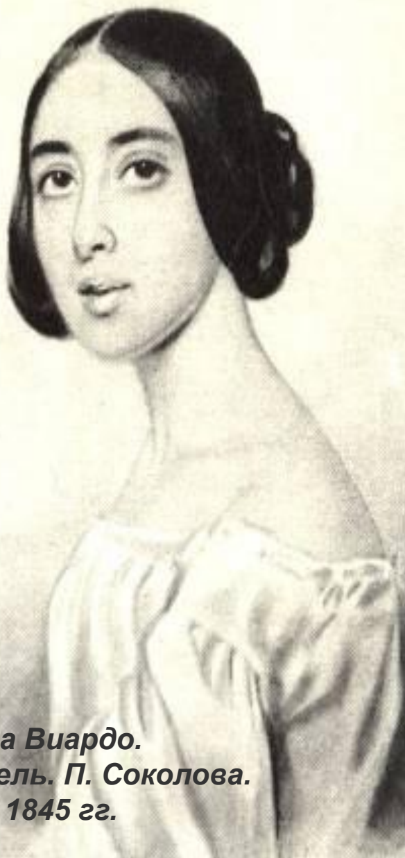
Полина Виардо. Акварель. П. Соколова. 1843 – 1845 гг.