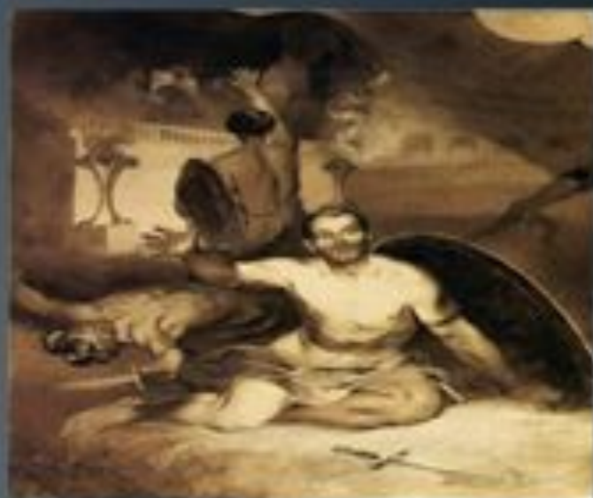
Ілюстрація до поезії М. Лермонтова «Умираючий гладіатор»