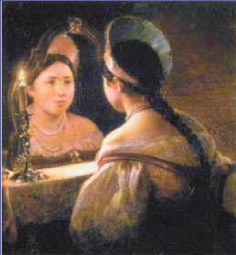
К. П. Брюллов “Гадающая Светлана”

Раз в крещенский вечерок Девушки гадали: За ворота башмачок, Сняв с ноги, бросали; Снег пололи; под окном Слушали; кормили Счетным курицу зерном; Ярый воск топили; В чашу с чистою водой Клали перстень золотой, Серьги изумрудны; Расстилали белый плат И над чашей пели в лад Песенки подблюдны.