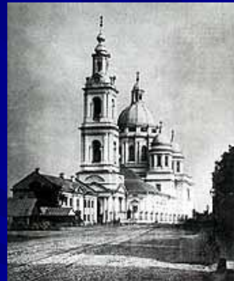
Елоховский собор, в которой крестили А. С.Пушкина