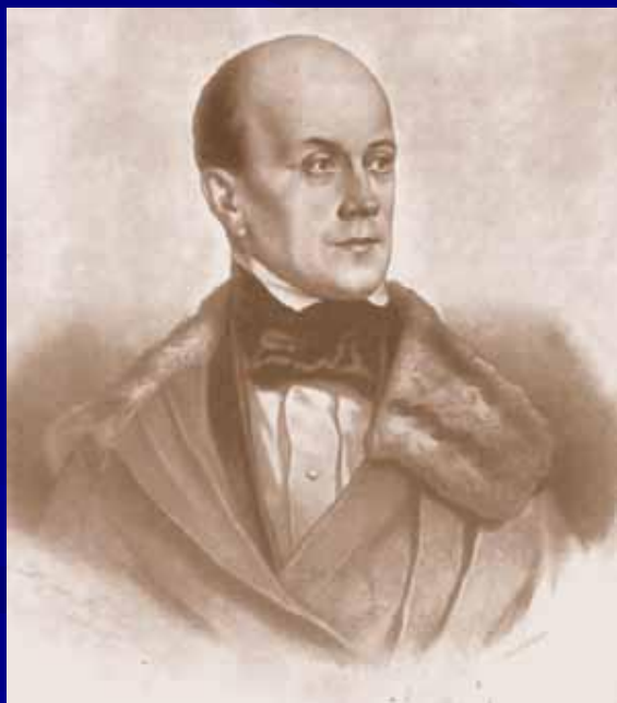
Петр Яковлевич Чаадаев