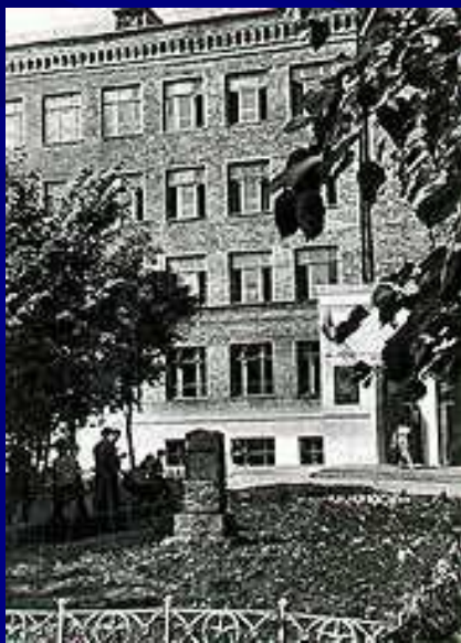
Школа №353 имени А.С.Пушкина