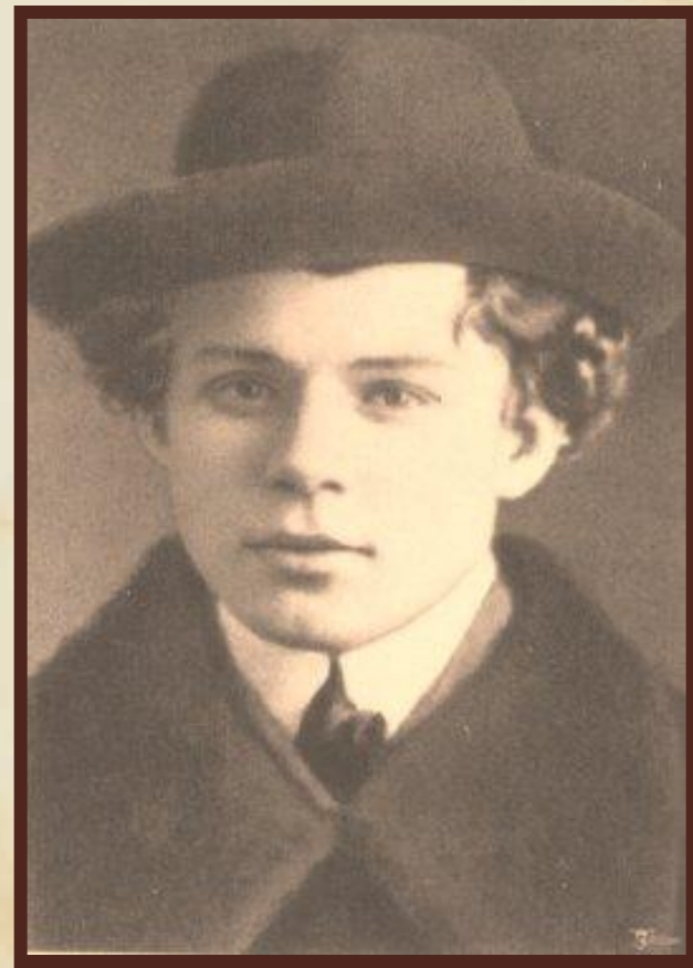
С.Есенин в 1919 году.

Сергей Александрович Есенин (род. 21 сентября(3 октября) 1895 г., село Константиново, Рязанская губерния – 28 декабря 1925 г., Ленинград) – русский поэт, представитель новокрестьянской поэзии(1914-1918 гг.), а позже и имажинизма(1918-1922 гг.)