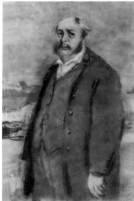
«Отцы и дети». Николай Петрович Кирсанов. Иллюстрация К. И. Рудакова. 1947 г.

Почему Николай Петрович не смог сделать военную карьеру как его брат Павел Петрович?