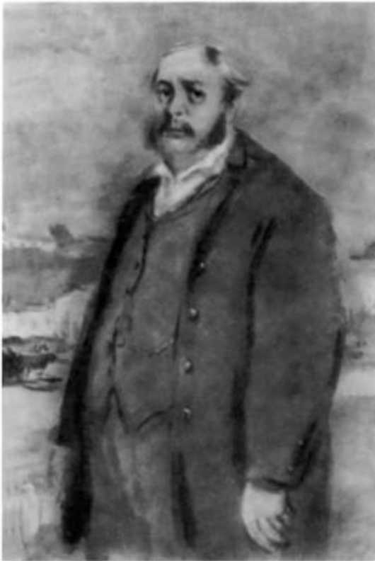
«Отцы и дети». Николай Петрович Кирсанов. Иллюстрация К. И. Рудакова. 1947 г.