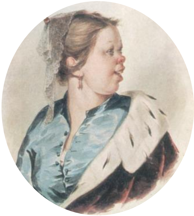
Евдокия Никитишна Кукшина