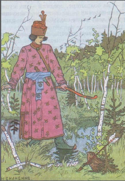
Царевна - лягушка