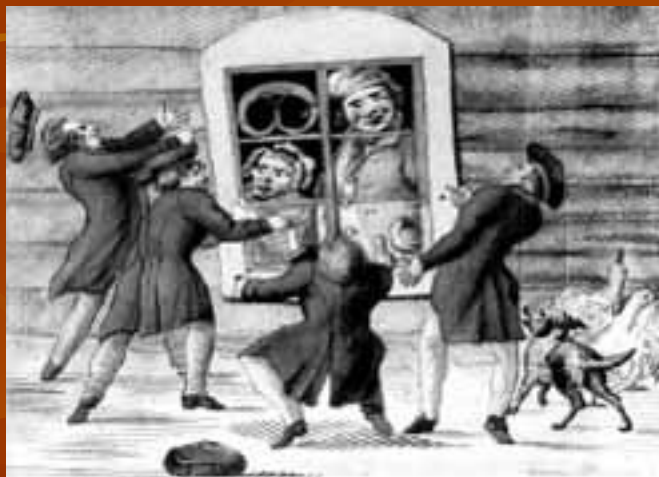
Рисунок из журнала «Лицейский мудрец»