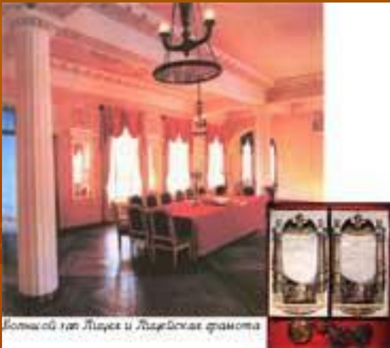
Большой зал Лицея и Лицейские фразы