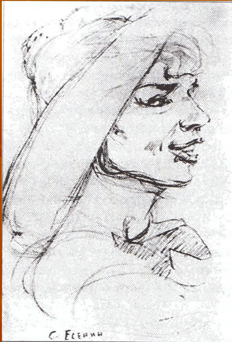
Сергей Есенин. Рисунок работы С. Т. Конёнкова.

Скульптор подарил сотрудникам музея фотокопию своего карандашного рисунка Сергея Есенина, оставил тёплую запись в книге почётных писателей. «Помните и любите нашего большого поэта Сергея Есенина, - сказал на прощание скульптор. – Ведь его голос был голосом народа». С.Т. Конёнков покидал «край задумчивый и нежный», родину великого русского поэта. Спустя год, он сам завершил свой долгий, богатый событиями и встречами жизненный и творческий путь.