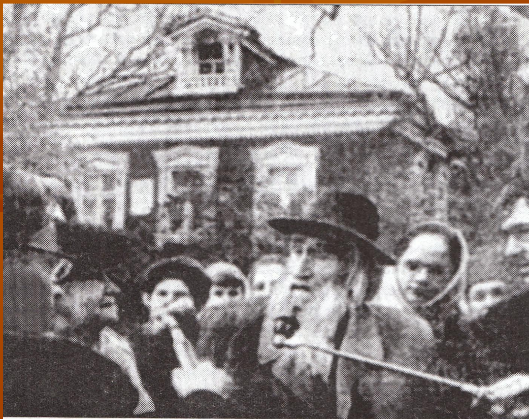
Друг юности С.А. Есенина выдающийся скульптор С.Т. Конёнков в возрасте 96 лет посетил родину поэта. Константиново, 23 октября 1970 г.

23 октября 1970 года, ненастным осенним днём, в Константиново, на родину поэта Сергея Есенина, приезжал девяностошестилетний художник Сергей Тимофеевич Конёнков в составе делегации деятелей культуры. Газета «Советская культура» проводила тогда на рязанской земле встречу тружеников села с мастерами искусств.