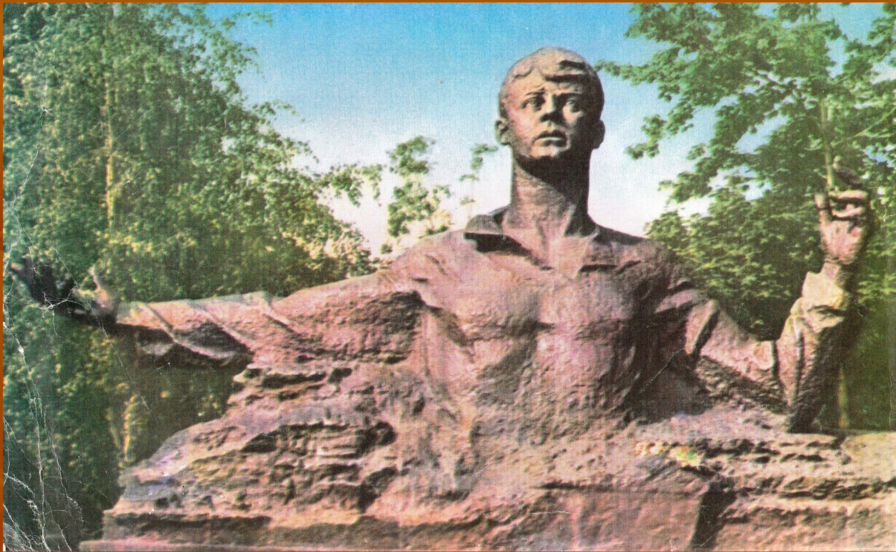
Памятник С. Есенину в г.Рязани. Скульптор А. П. Кибальников. 2 октября 1975 г.состоялось торжественное открытие.