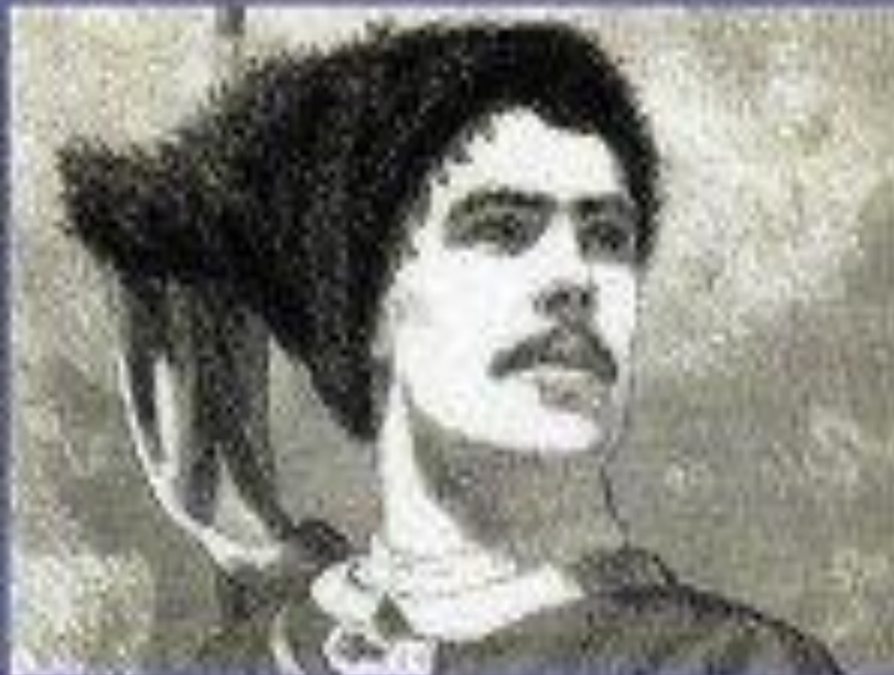
• Е.Укр. Остап