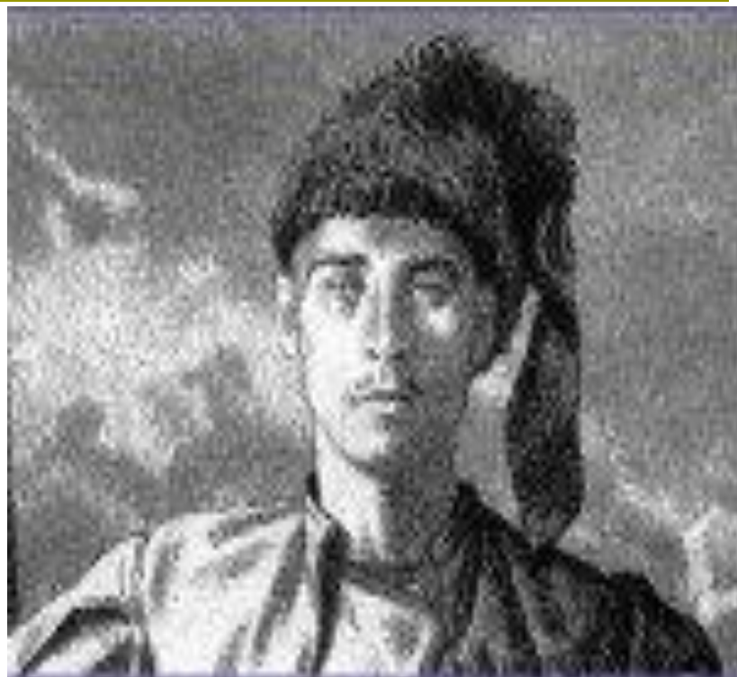
• Е.Укр. Андрий