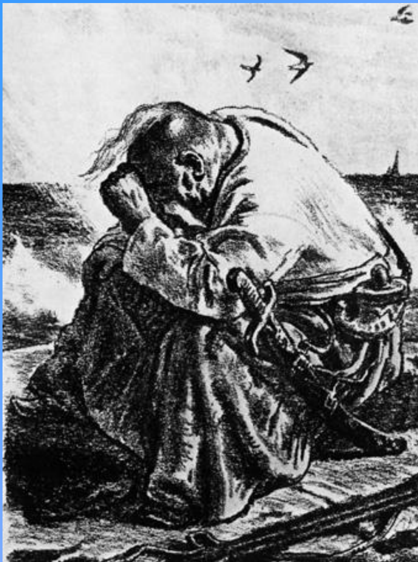
Тарас после казни Остапа