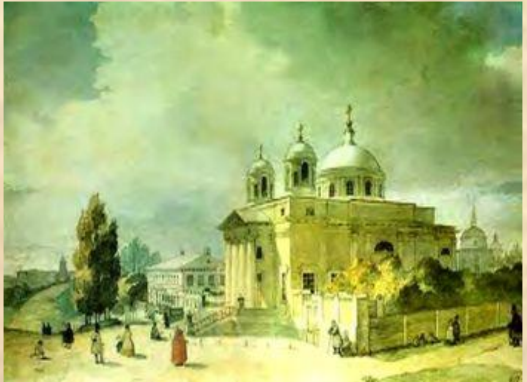
Т.Г.Шевченко. Собор святого Олександра в Києві

Спілкувався з селянами, познайомився з численними представниками української інтелігенції й освіченими поміщиками.