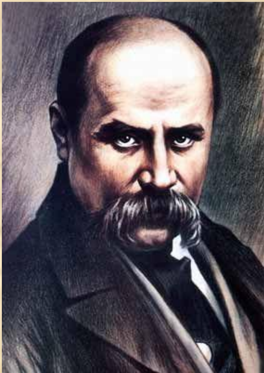
Тарас Григорович Шевченко (1814 - 1861)