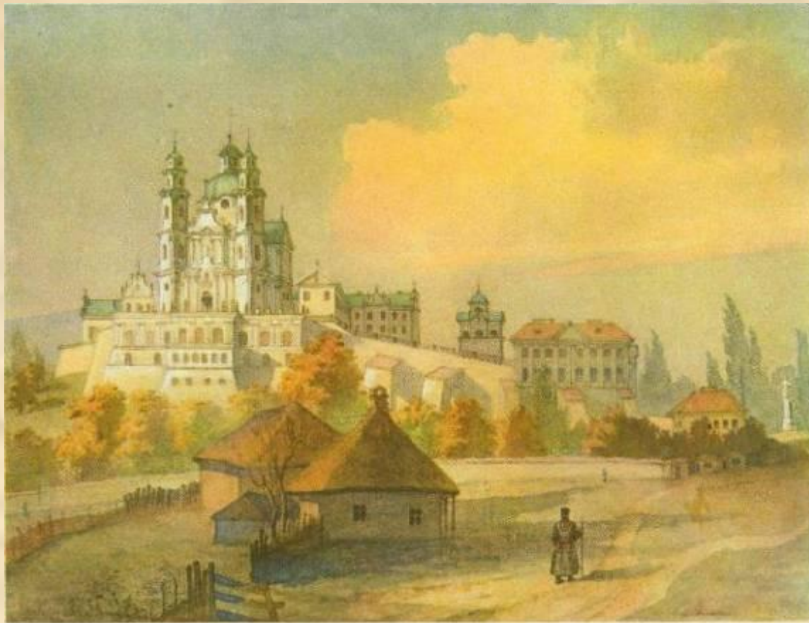
148. ПОЧАЙІВСЬКА ЛАВРА З ПІВДНЯ. Акварель. [X. 1846].

На Україні Шевченко написав два поетичних твори — російською мовою поему “Тризна” (1844р. опублікована в журналі “Маяк” під назвою “Бесталанний”) і вірш “Розрита могила”.