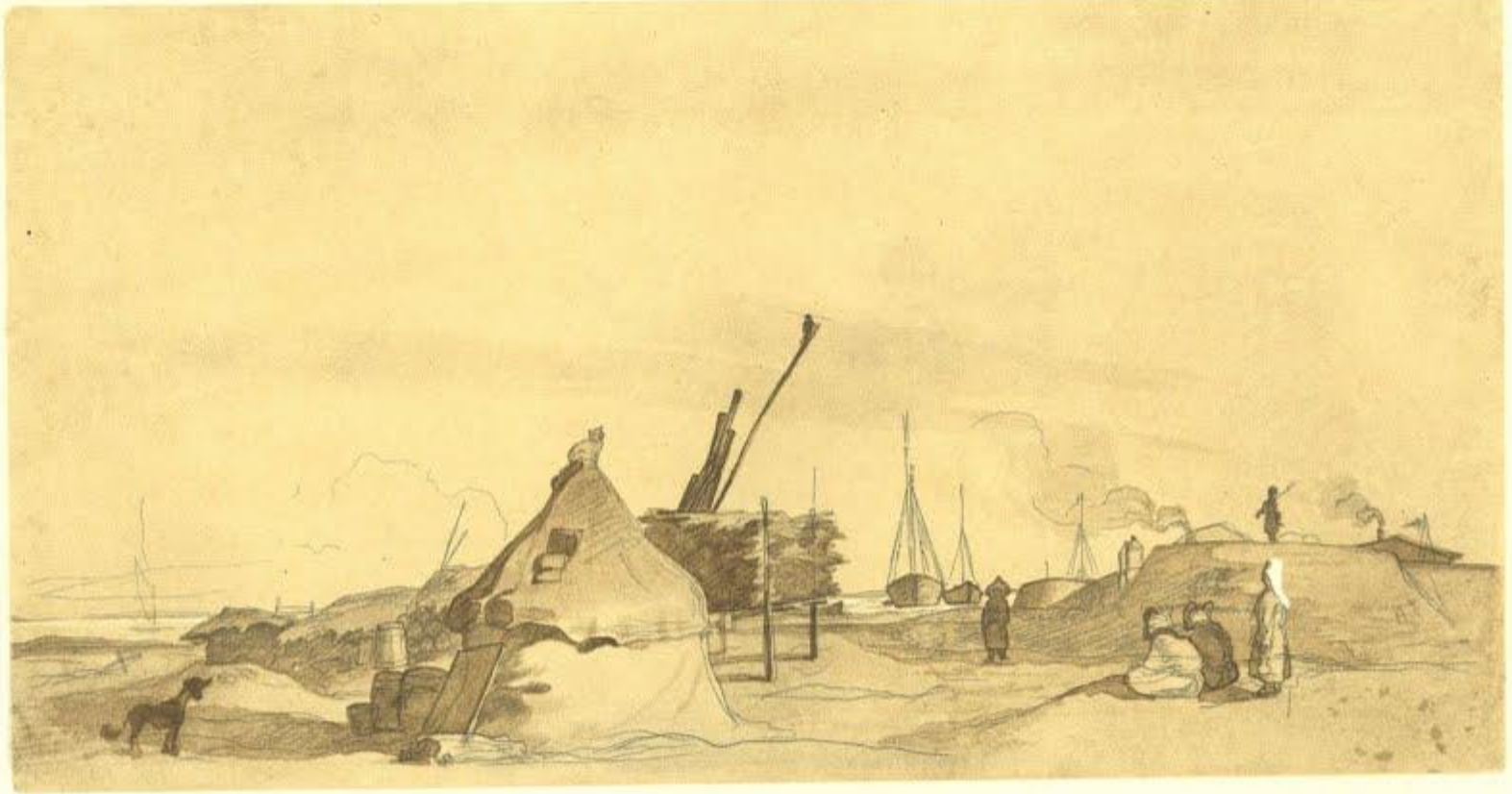
35. УКРІПЛЕННЯ КОС-АРАЛ ВЗИМКУ. Сепія. [6.X 1848—2.IV 1849].

У 1848р. на клопотання Шевченкових друзів його включили як художника до складу Аральської описової експедиції, очолюваної О. Бутаковим. З жовтня 1848р. до травня 1849р. експедиція зимувала на острові Кос-арал.