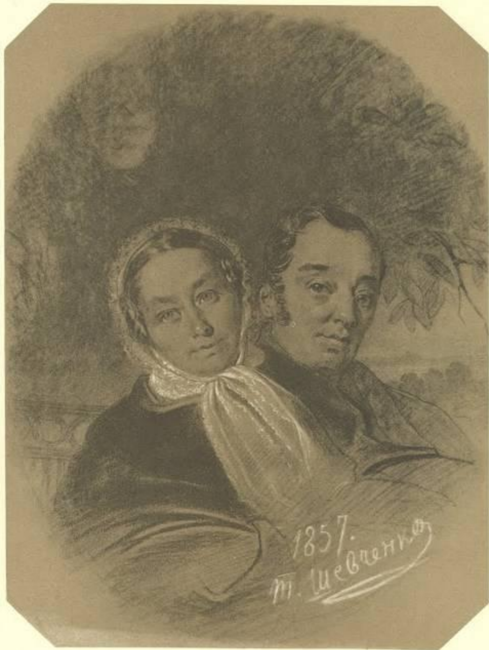
16. ПОРТРЕТ ПОДРУЖЖЯ ЯКОБИ. Італійський та білий олівець. [8—9.XI] 1857.

У Вільно Шевченко виконує обов'язки козачка в панських покоях. А у вільний час потай від пана перемальовує лубочні картинки. Шевченка віддають вчитися малюванню. Найвірогідніше, що він короткий час учився у Яна-Батіста Лампі (1775 — 1837), який з кінця 1829р. до весни 1830р. перебував у Вільно, або в Яна Рустема (? — 1835), професора живопису Віленського університету.