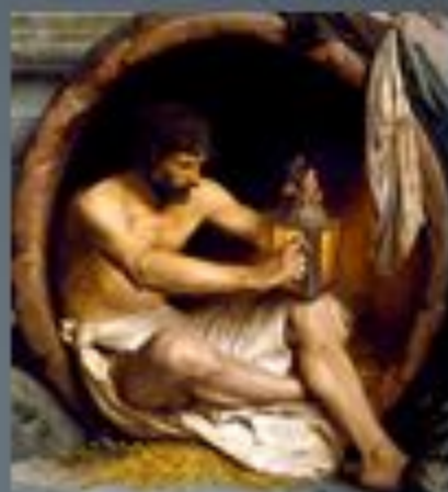
«Діоген», 1856 р.