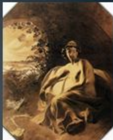
«Телемак на острові Каліпсо», 1836 р.