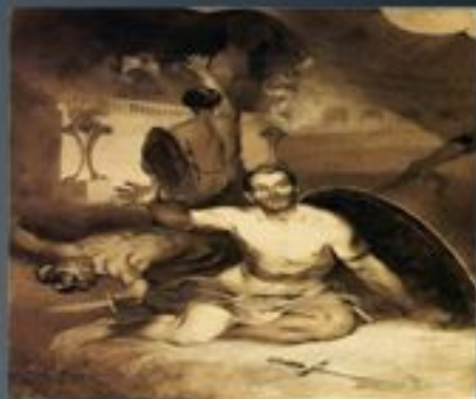
Ілюстрація до поезії М. Лермонтова «Умираючий гладіатор»