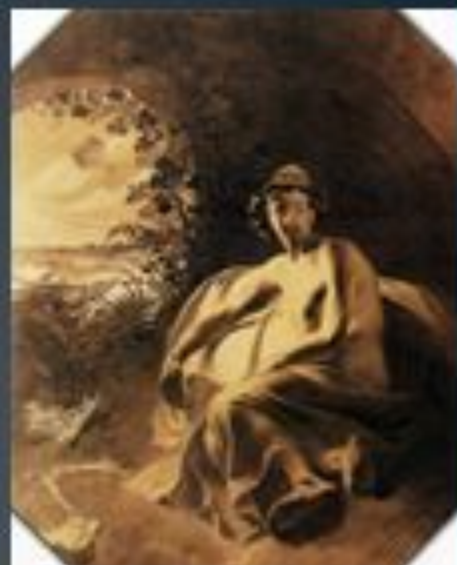
«Телемак на острові Каліпсо», 1836 р.