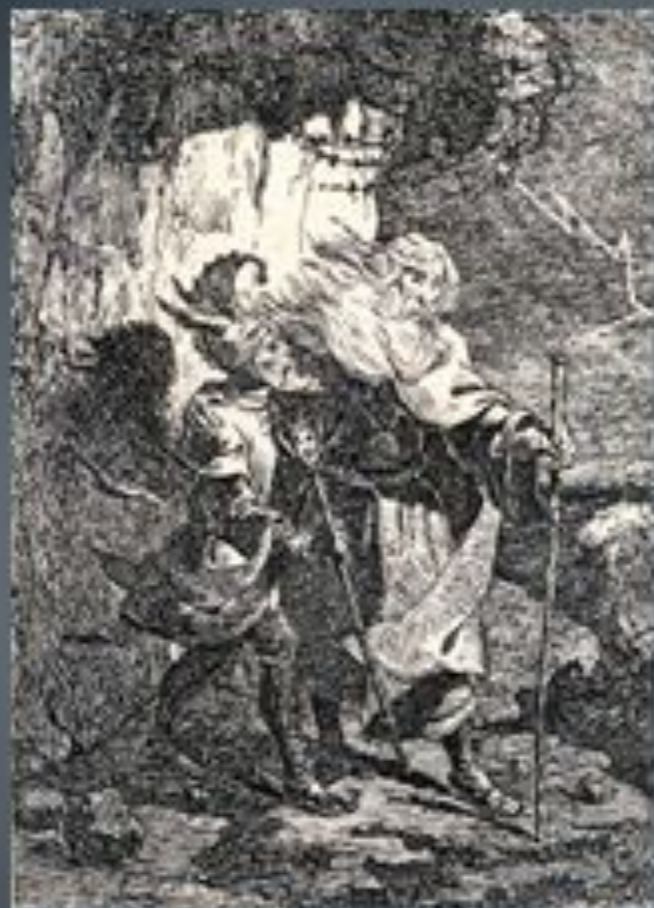
«Король Лір». Композиція на тему однойменної трагедії Шекспіра, 1843 р.