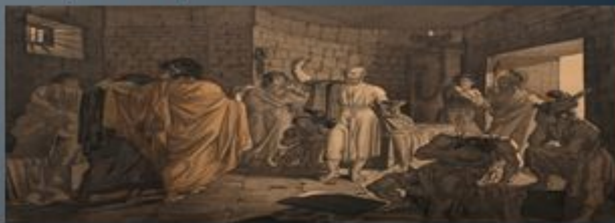
«Смерть Сократа», 1837 р.