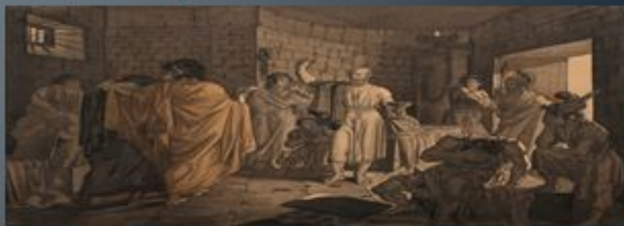
«Смерть Сократа», 1837 р.