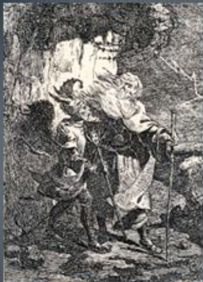
«Король Лір». Композиція на тему однойменної трагедії Шекспіра, 1843 р.