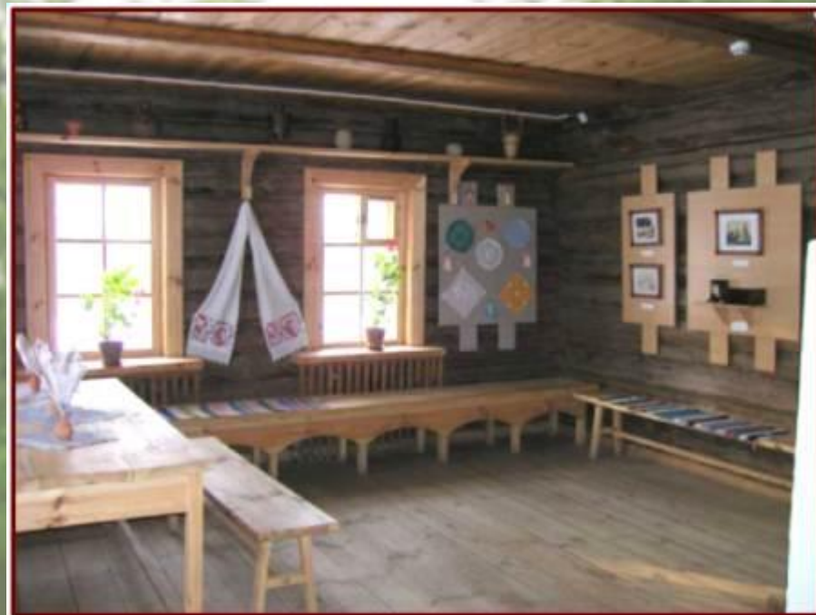
Фрагмент экспозиции в доме ключника «Быт тарханских крестьян лермонтовского времени»