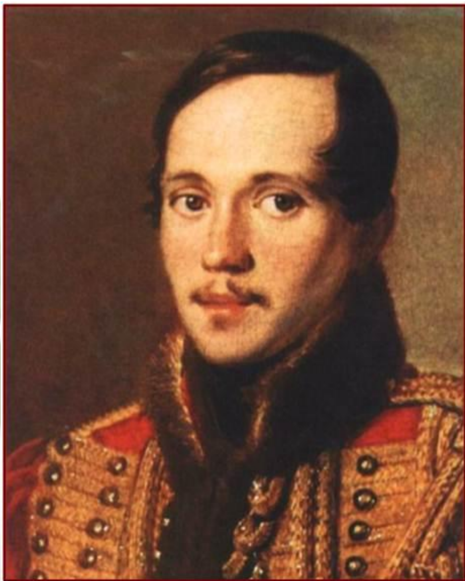
Худ. П.Е. Заболотский, 1837