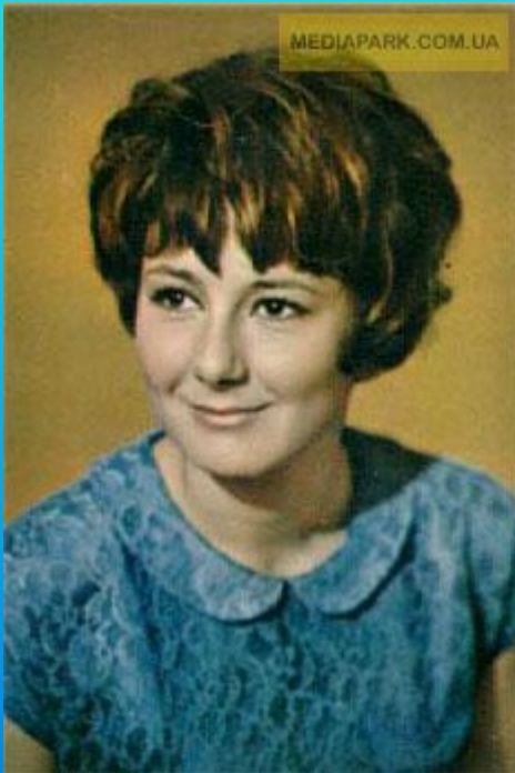
актриса Татьяна Лаврова.

Исконно русское женское имя Татьяна на самом деле имеет иностранные корни, что, впрочем, вовсе и не удивительно: большинство русских женских имен — не русские. Происхождение и точное значение имени «Татьяна» покрыто тайной за семью печатями.