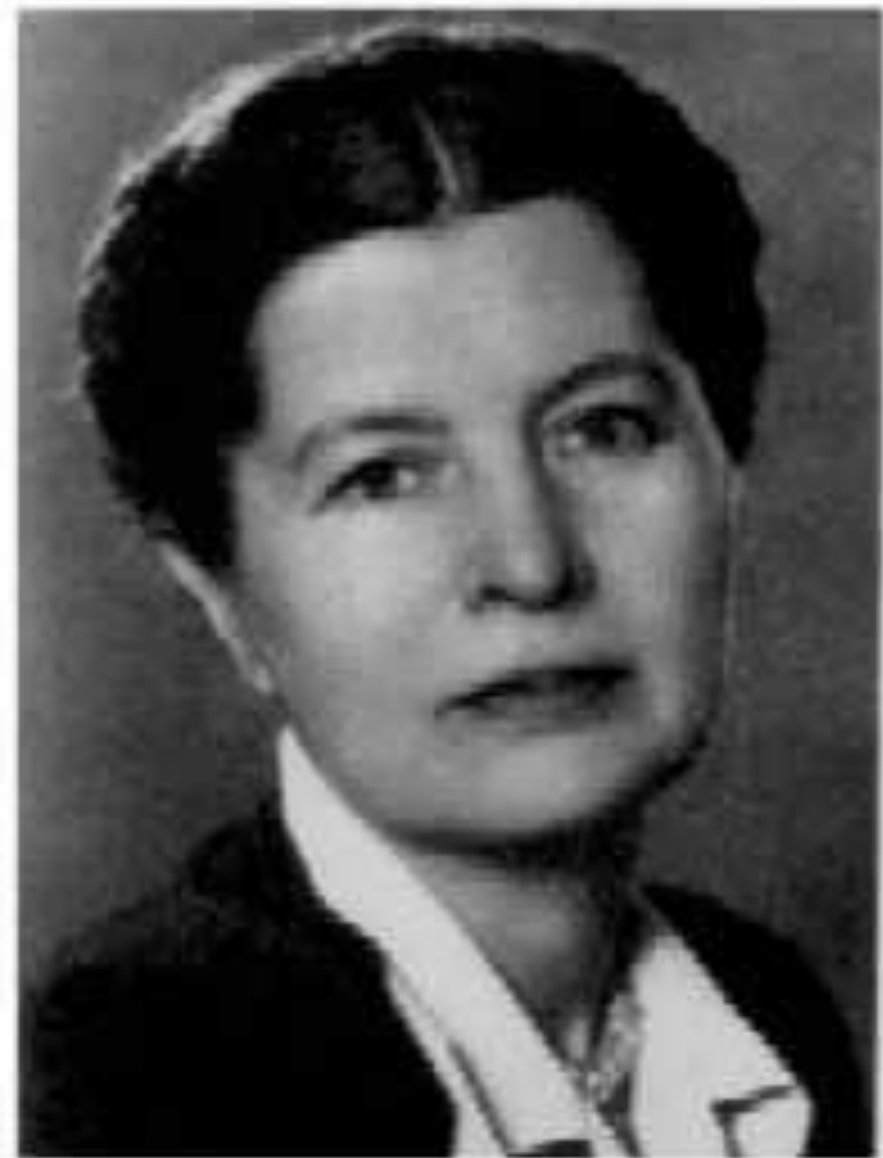
Елена Александров на Благинина