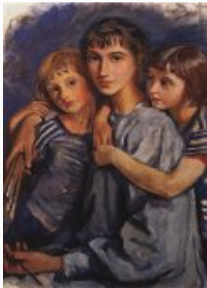
Автопортрет с дочерьми