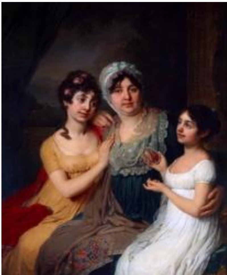
Безбородко с дочерьми дочерьми