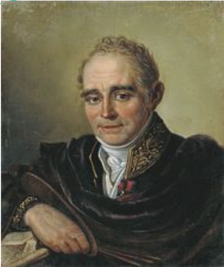
Владимир Боровиковский Серебрякова