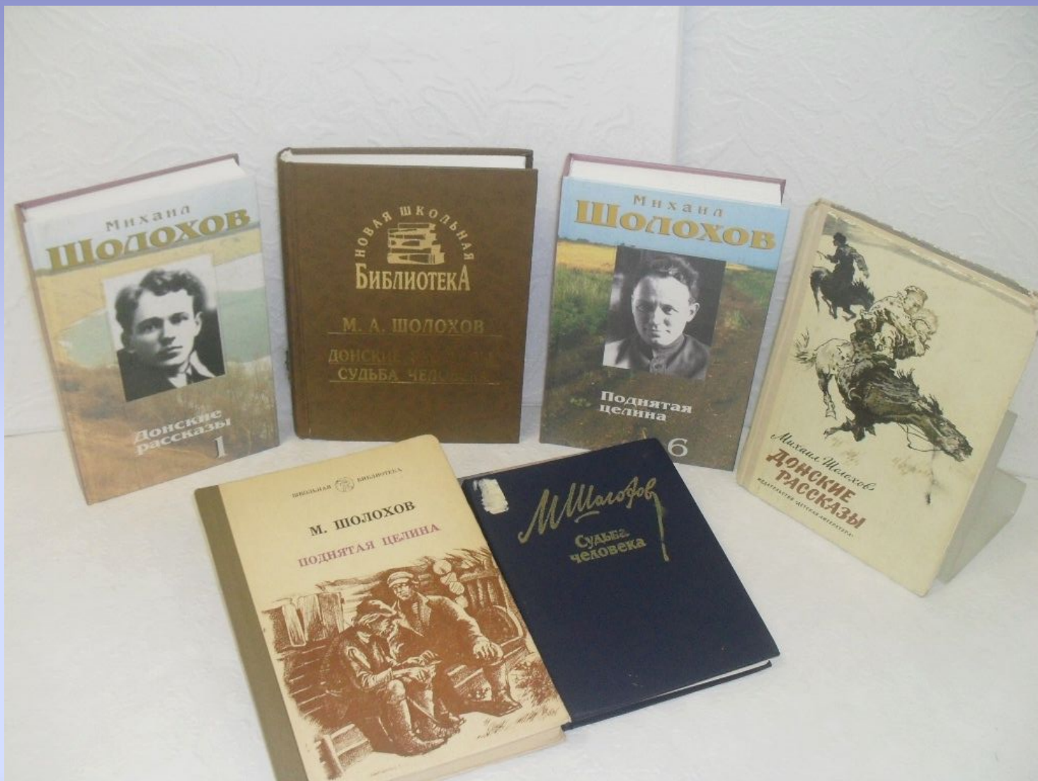
Фото. Книги М.А.Шолохова из библиотеки Корпуса.