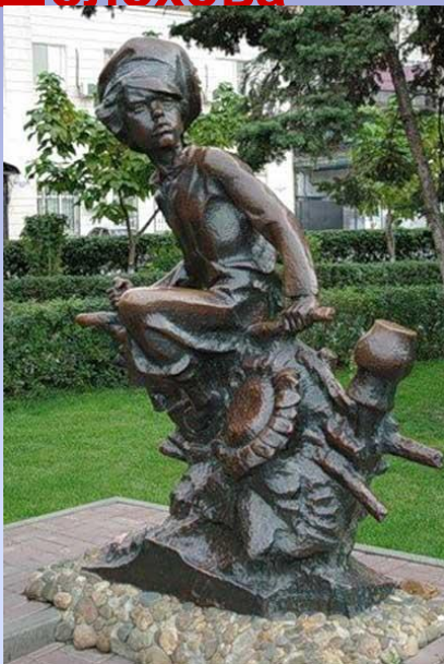
1982 г. Ростов-на-Дону. Памятник Нахаленку. Скульптор памятника— Н.В.Можяев, архитектор В.И. Волошин, соавтор Э.М. Можяева.