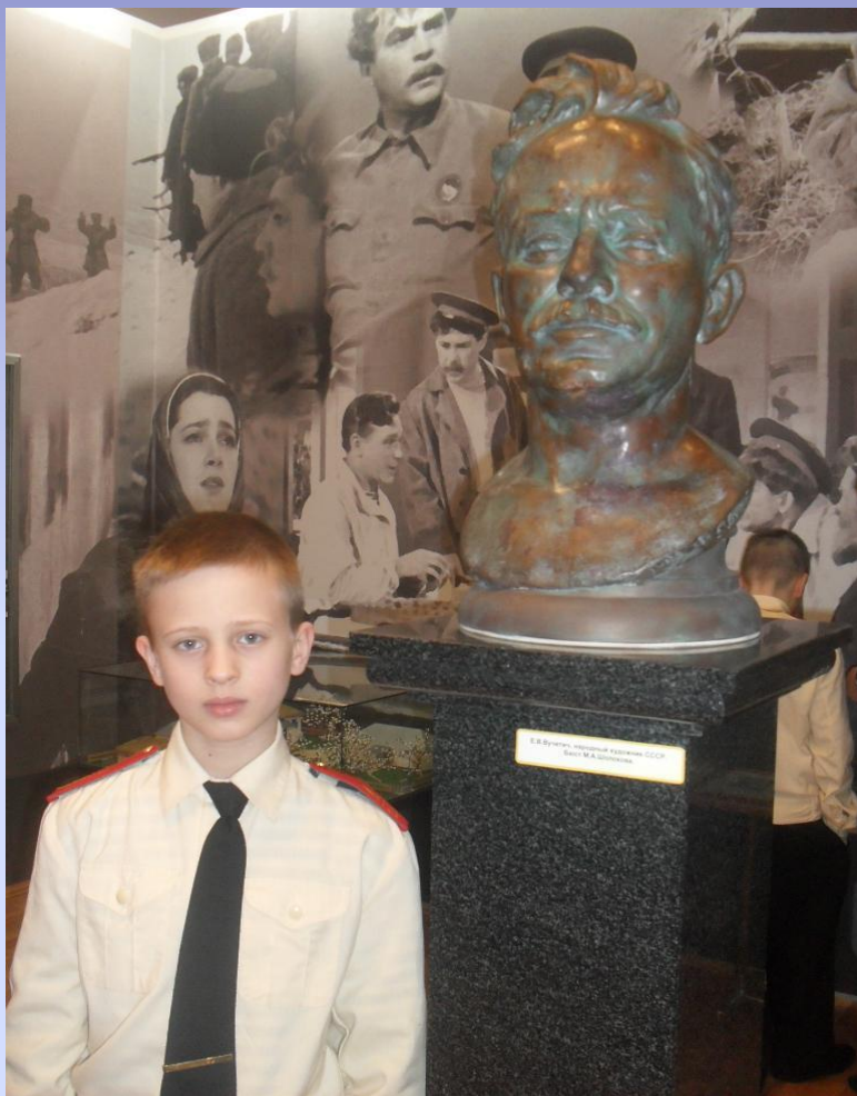
Фото. Мемориальная комната-музей М.А.Шолохова в МККК им.М.А.Шолохова.