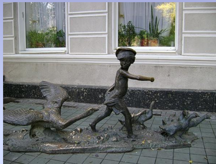
1980г. Ростов-на-Дону. Памятник Нахаленок и гуси. Скульптор памятника— Борис.Можайский.