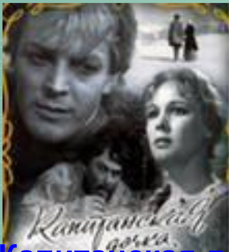
«Капитанская дочка» времени»