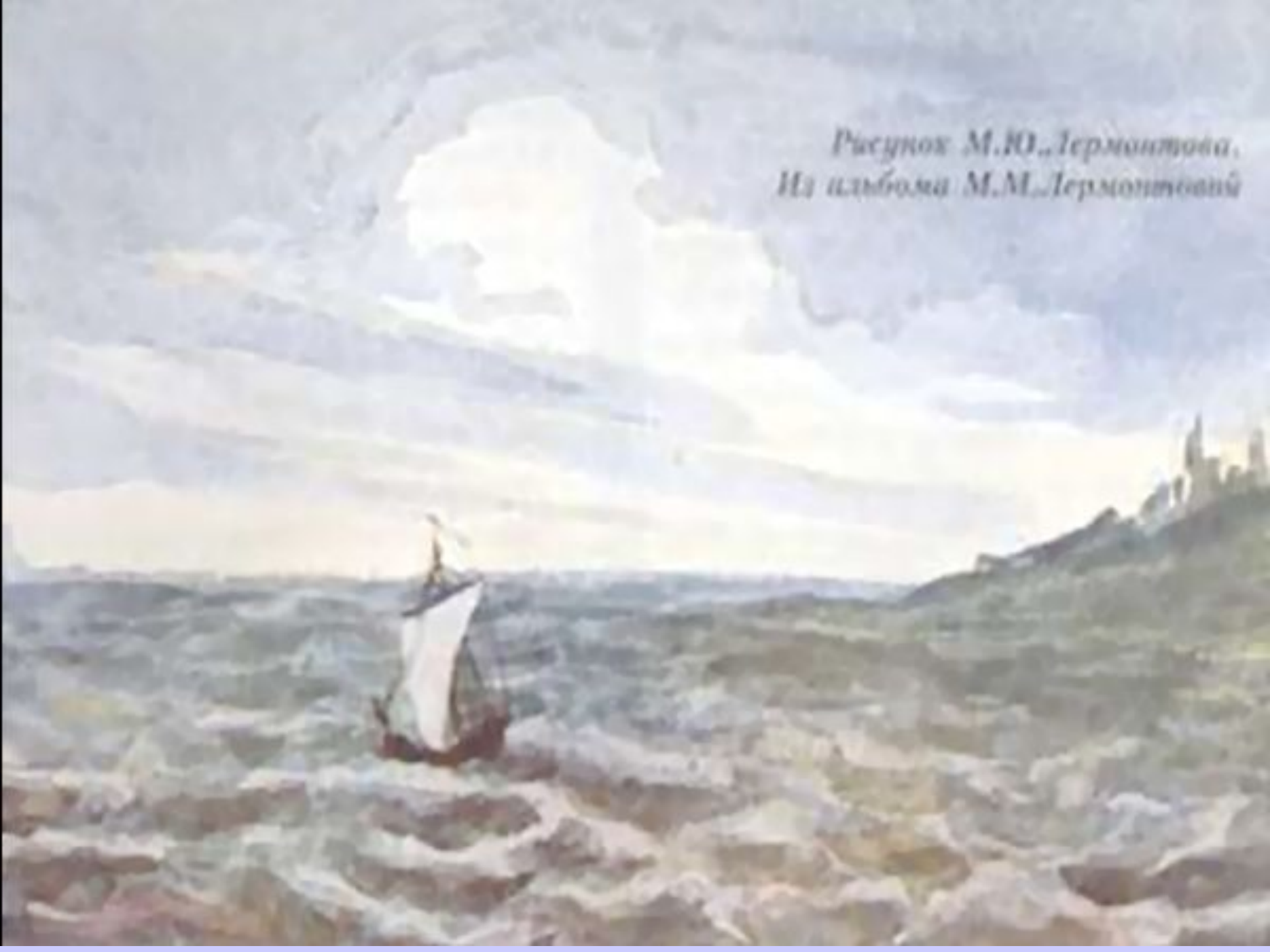
Рисунок М.Ю. Лермонтова. Из альбома М.М. Лермонтовой