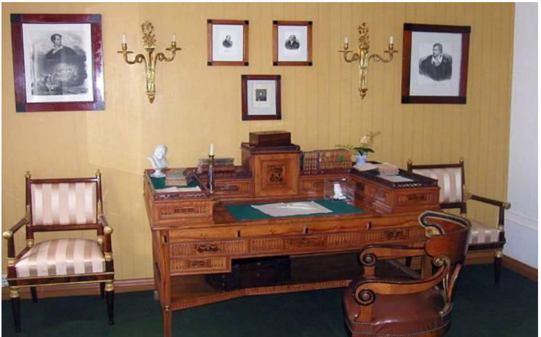
Рабочий кабинет поэта в Тарханах.