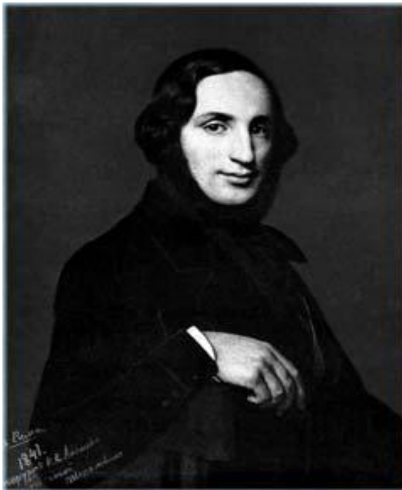
Айвазовский И. К.