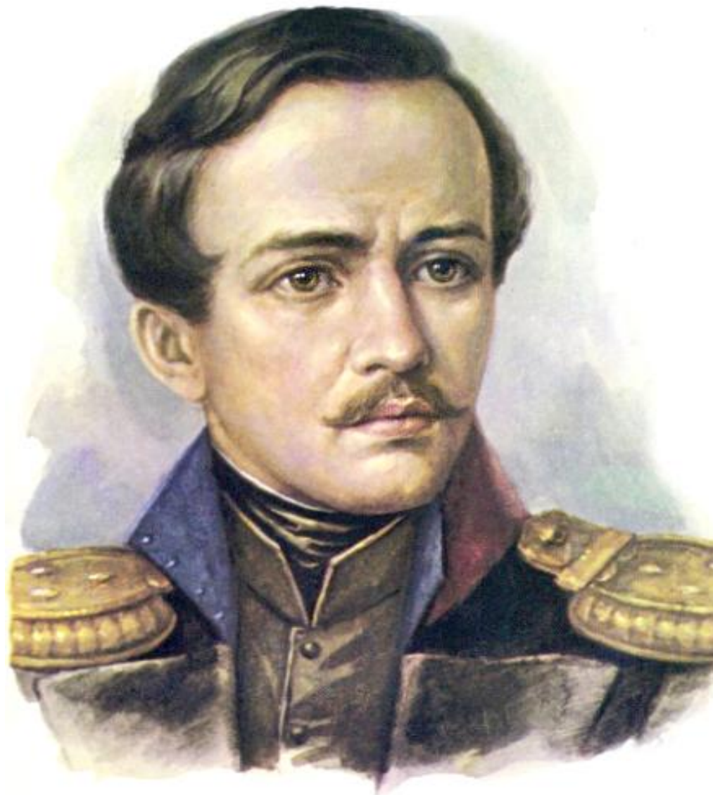
Михаил Юрьевич Лермонтов (1814 – 1841)