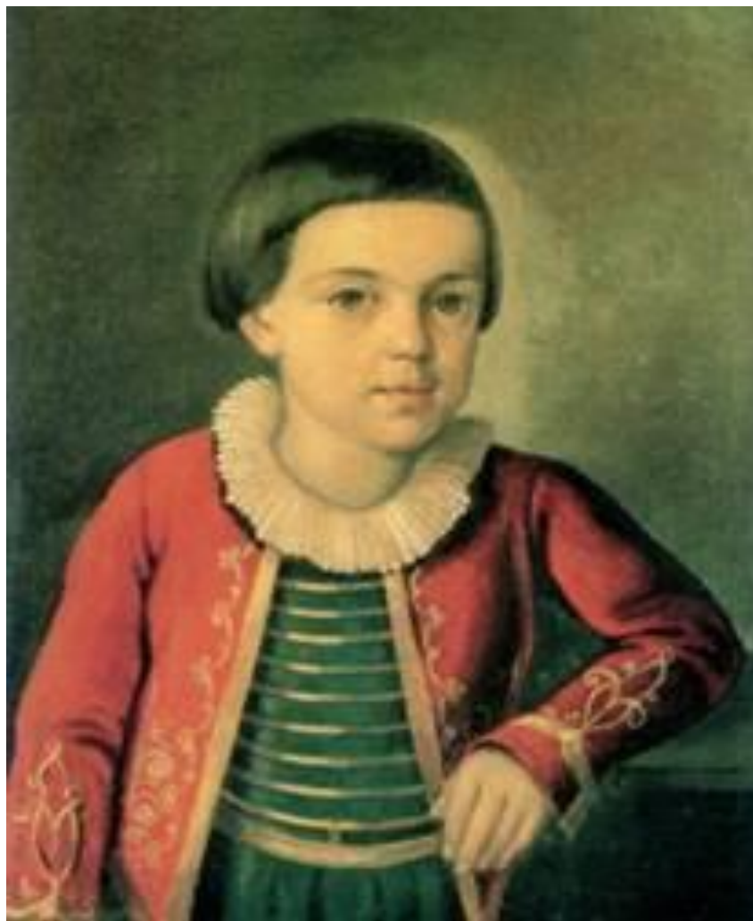
М.Ю.Лермонтов в детстве. Неизвестный художник. 1820-1822 гг.