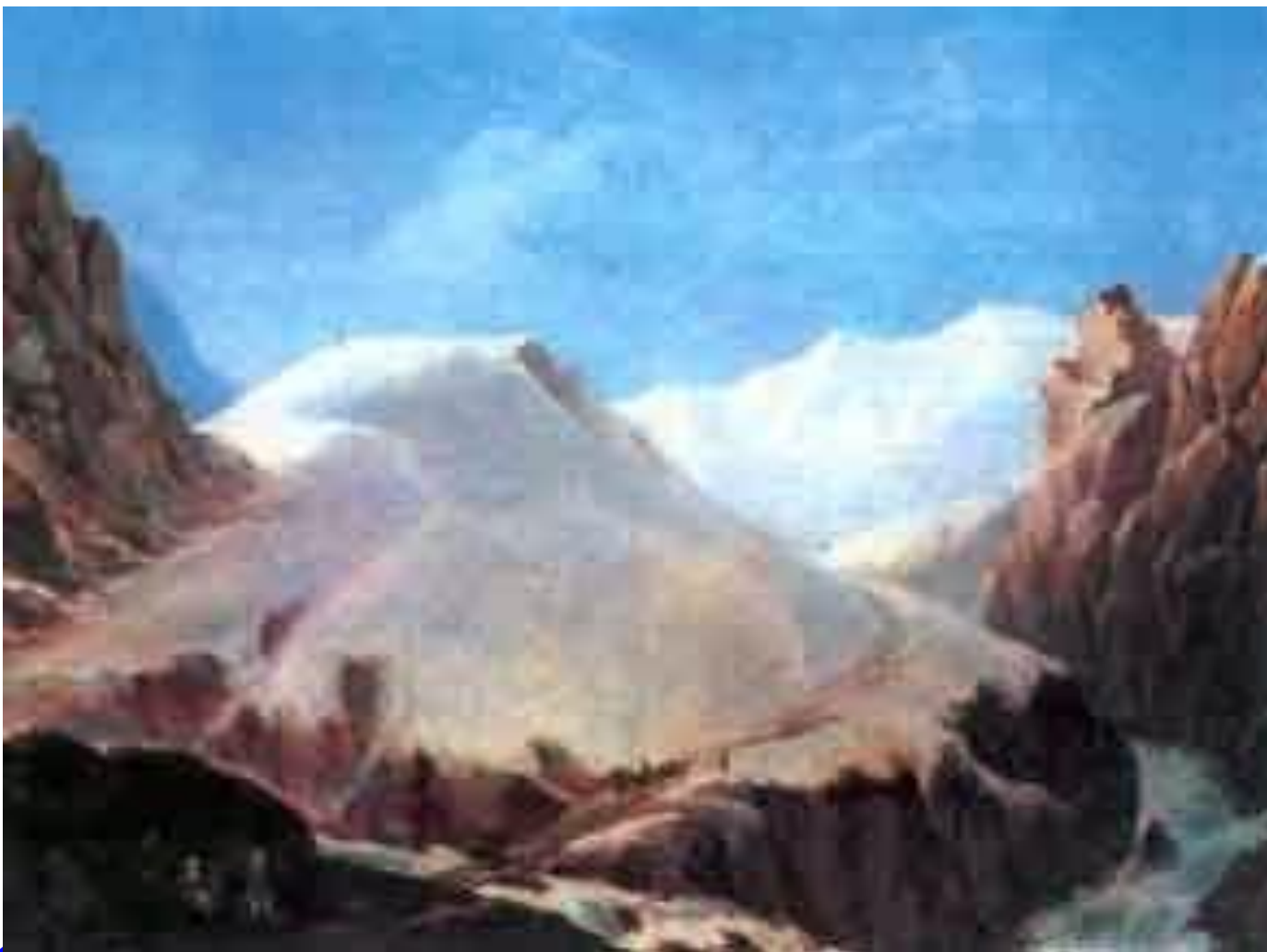
«Крестовый гор» - одна из лучших работ М.Ю. Лермонтова. 1837 год.