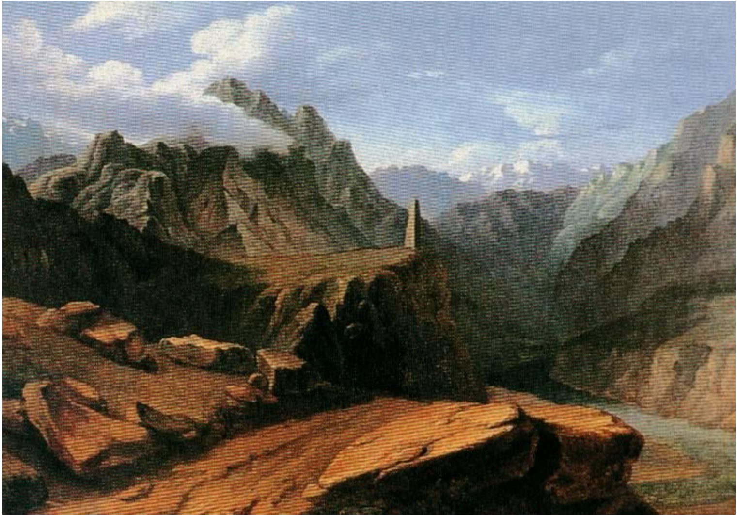
Кавказ. Акварель М.Ю.Лермонтова.