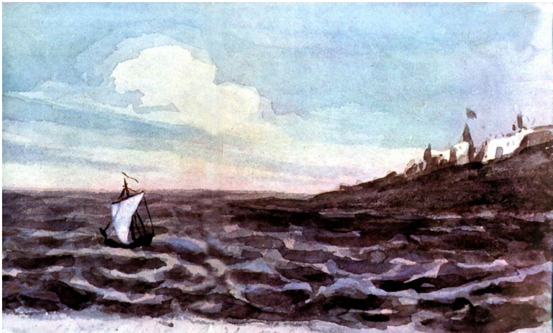
«Парус». Акварель Лермонтова.