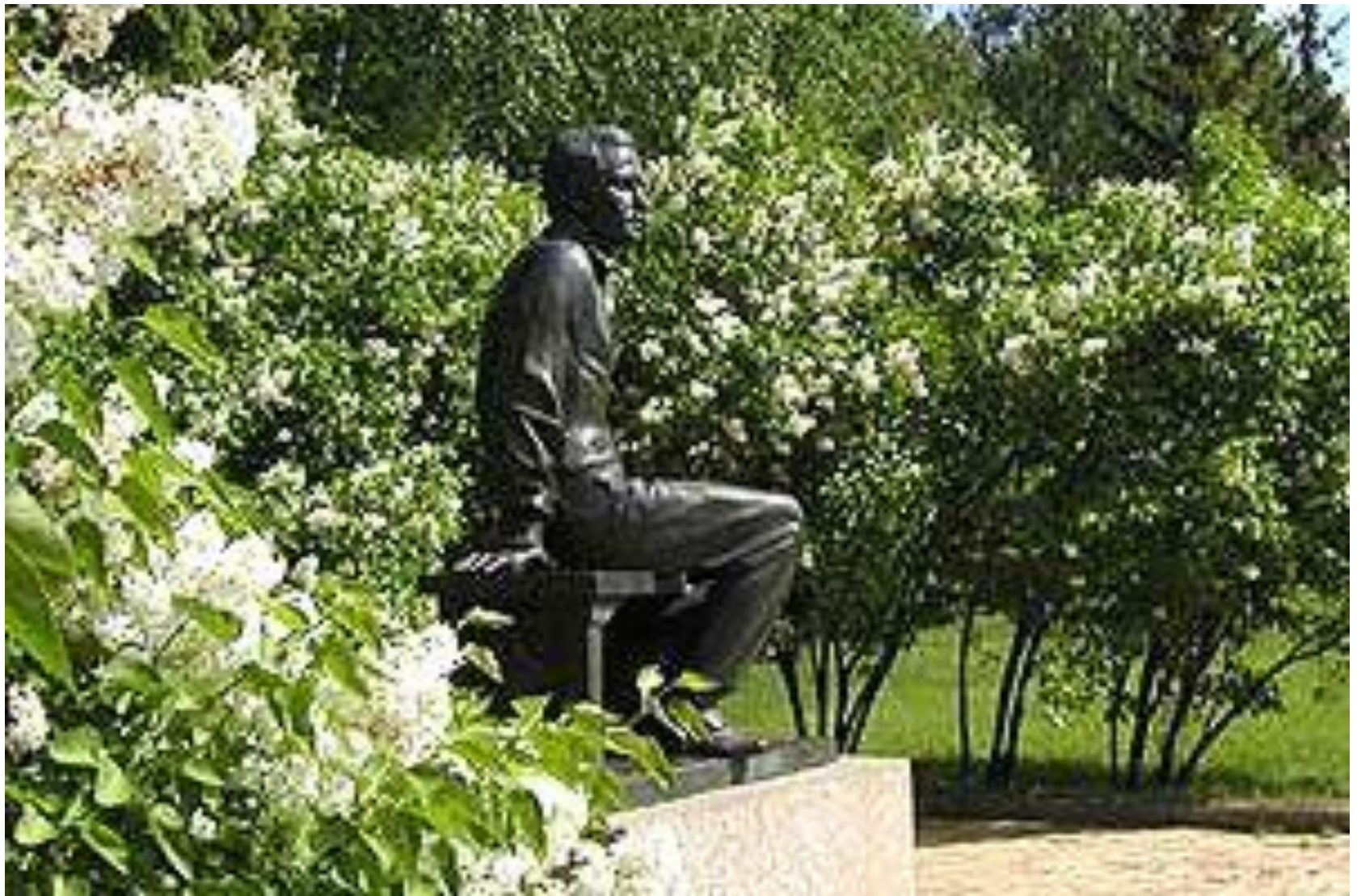
Памятник М.Ю.Лермонтову в Тарханах.