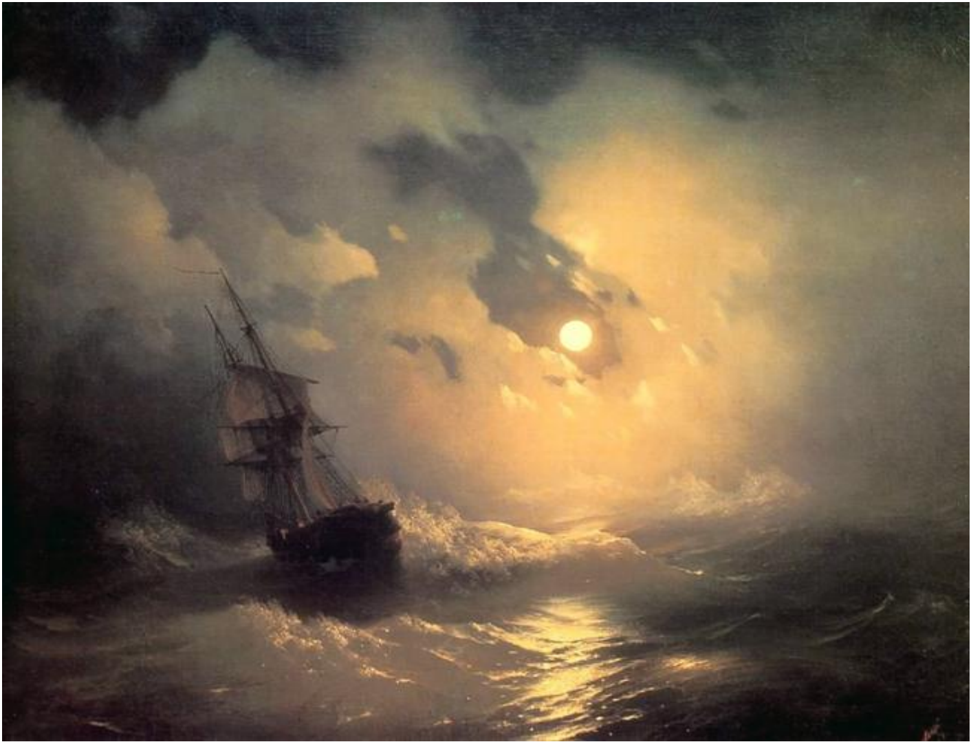
И. К. Айвазовский. «Буря на море ночью». 1849 г. Холст, масло.