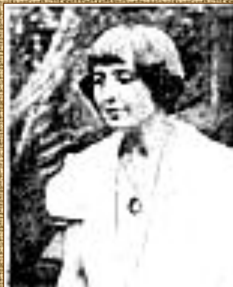
Прага, 1939 г.