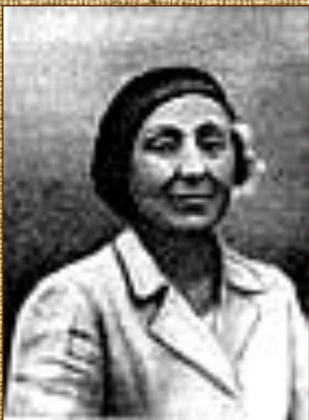
Елабуга, 1941 г.