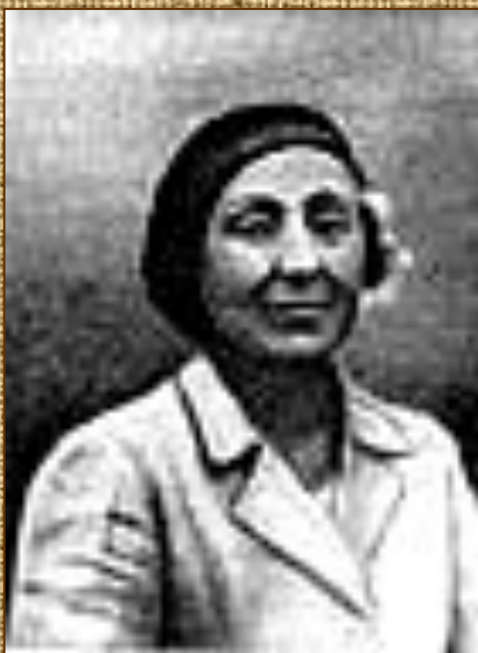
Елабуга, 1941 г.