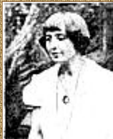
Прага, 1939 г.