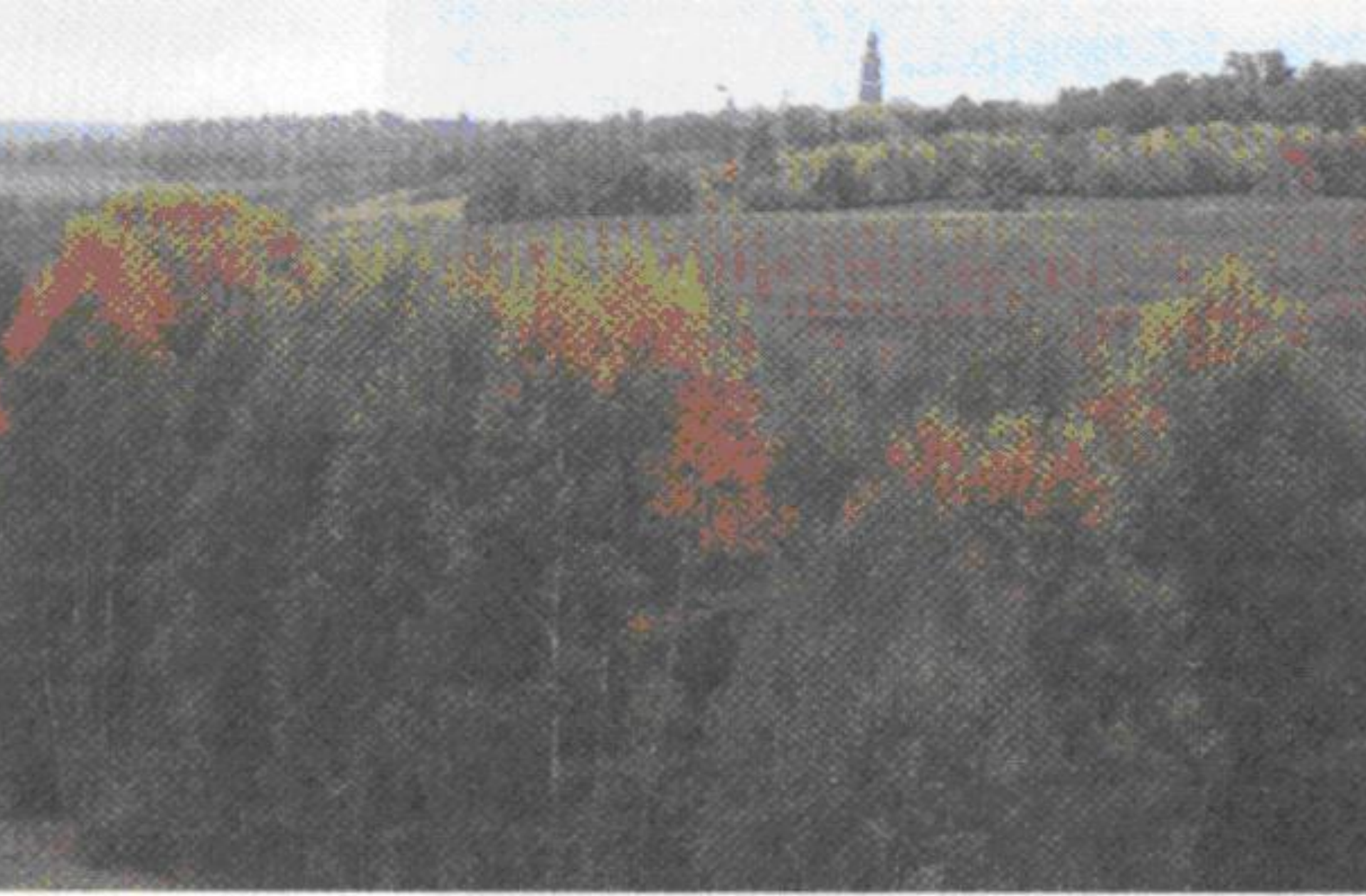
Окрестности села Константиново