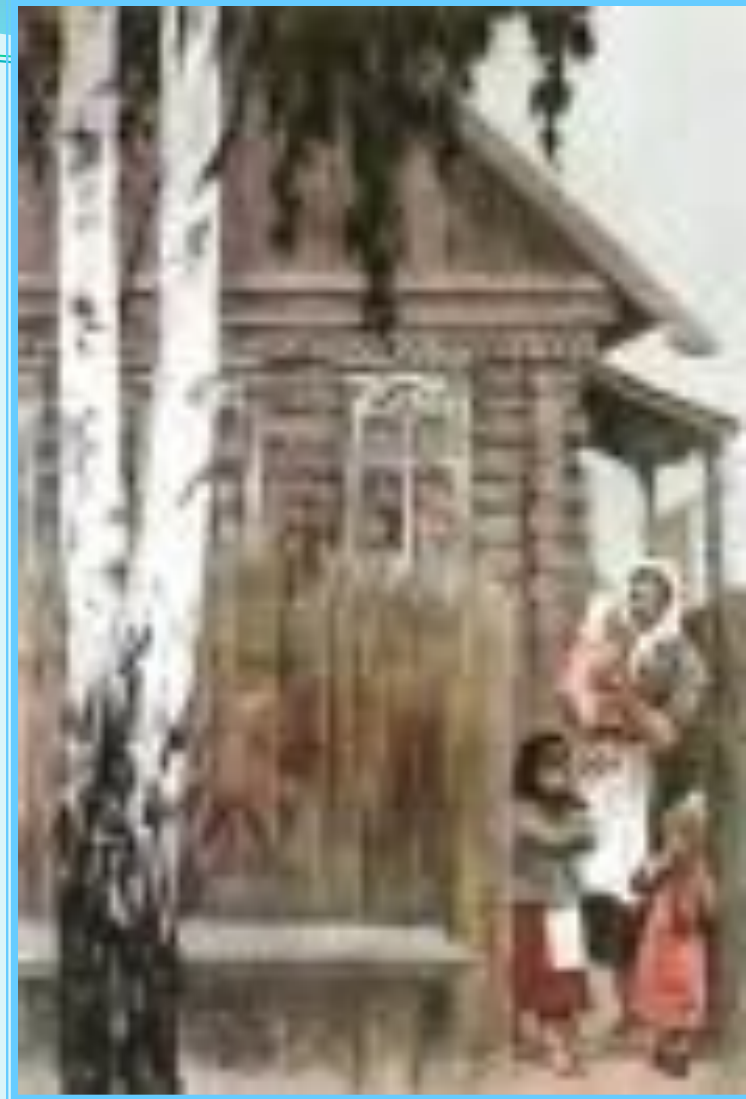
Иллюстрация к поэме «Дом у дороги». 📢