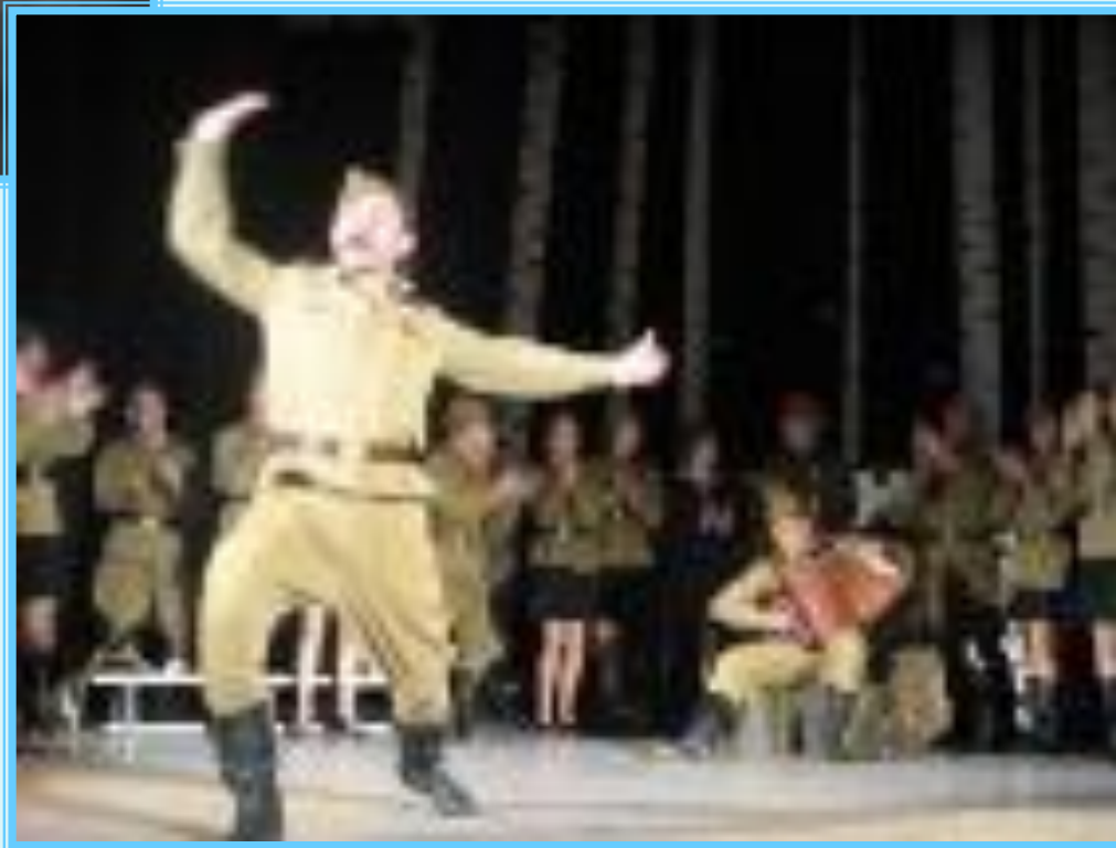
Сцены из спектакля «Василий Теркин»