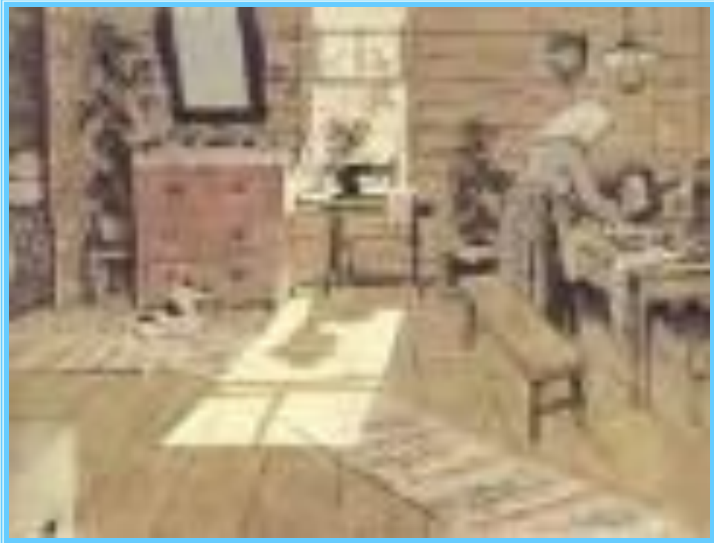
О.Верейский. К поэме «Дом у дороги».