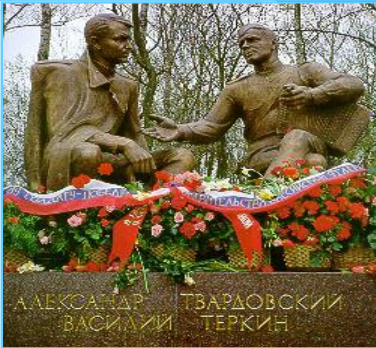
Памятник в г.Смоленске