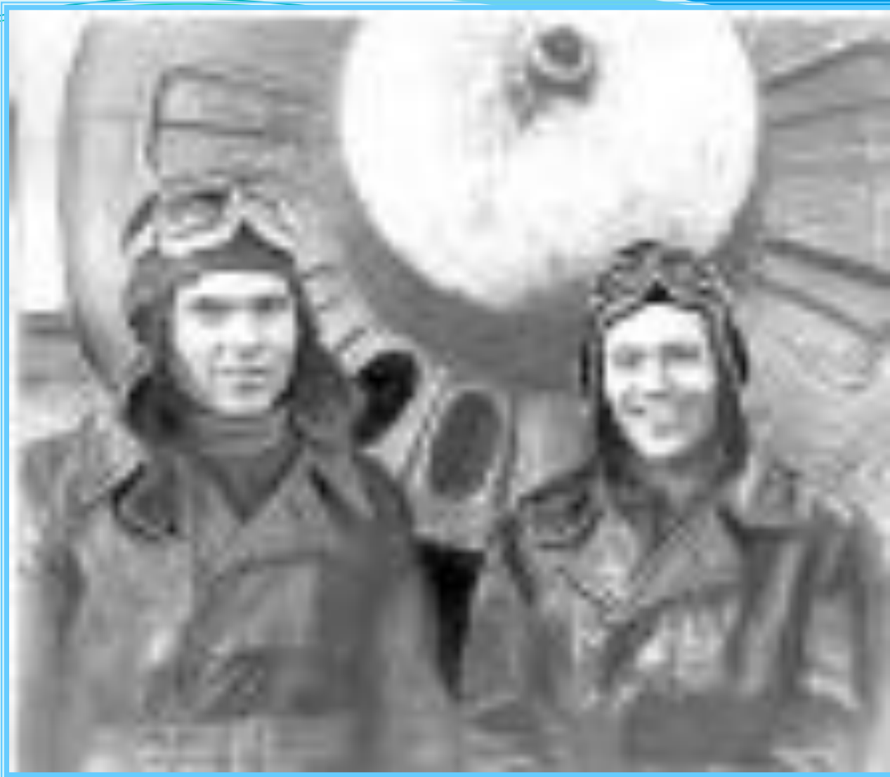
Твардовский А.Т. и поэт Алексей Сурков.