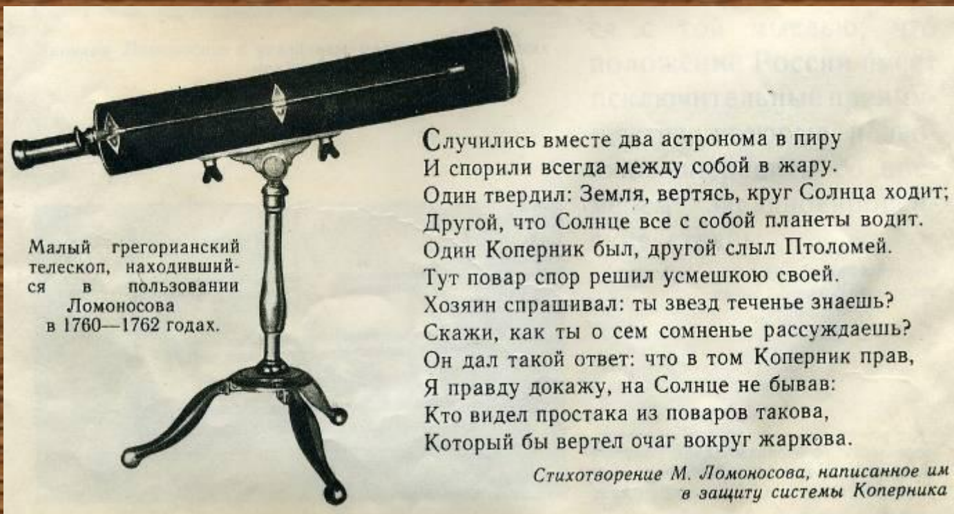
Малый грегорианский телескоп, находившийся в пользовании Ломоносова в 1760—1762 годах.

Сделал 23 открытия в области физики, химии, астрономии, географии, металлургии, истории и других наук.