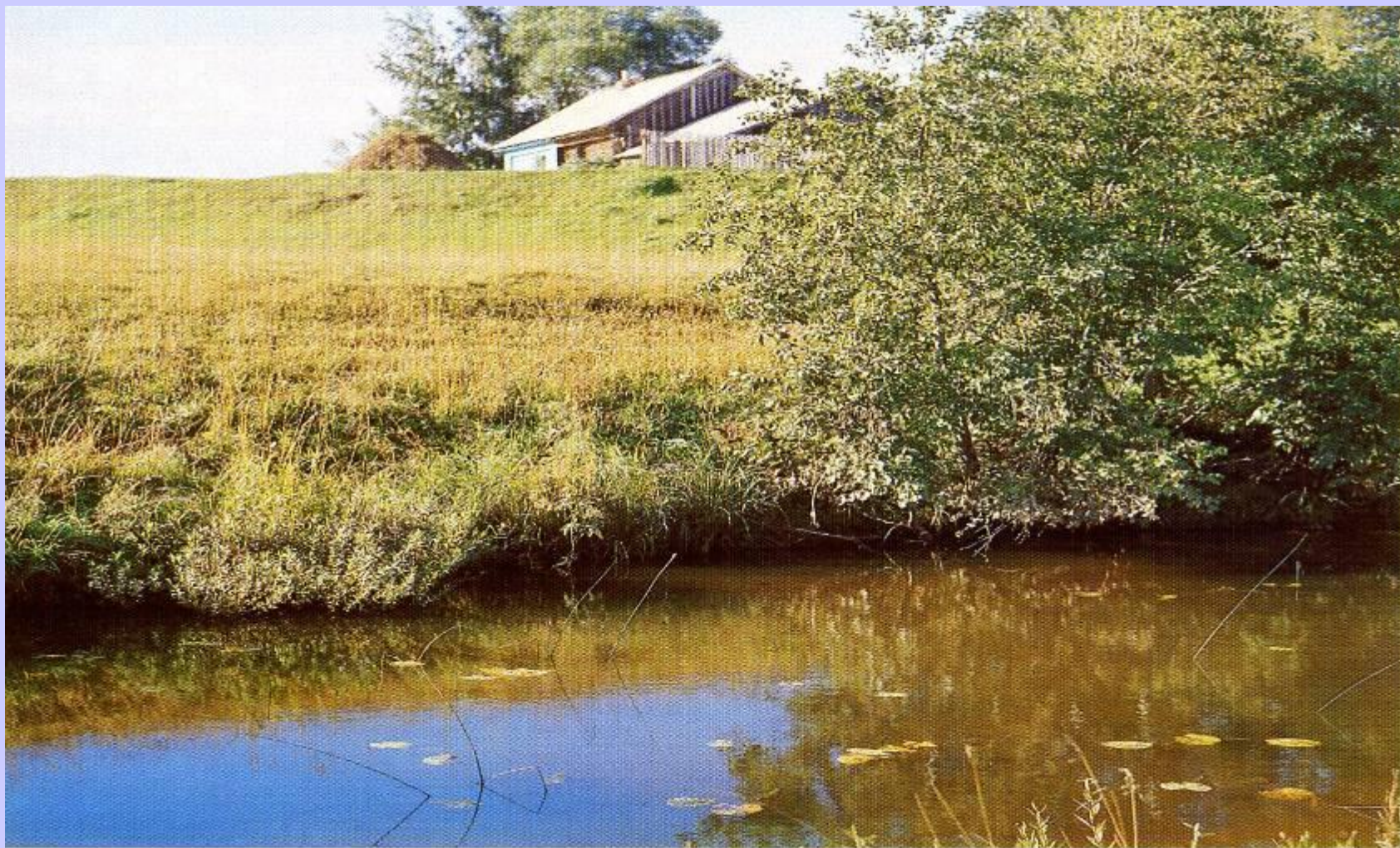
Речка Самарка около Грешнева.