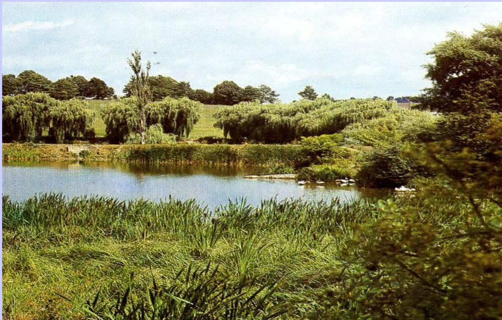
Уголок старого парка в Немирове.