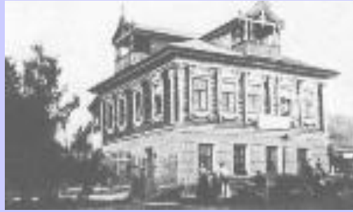
Дом-усадьба в Грешнёво