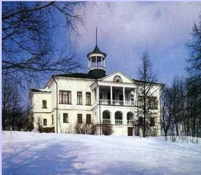
Дом-музей в Карабихе