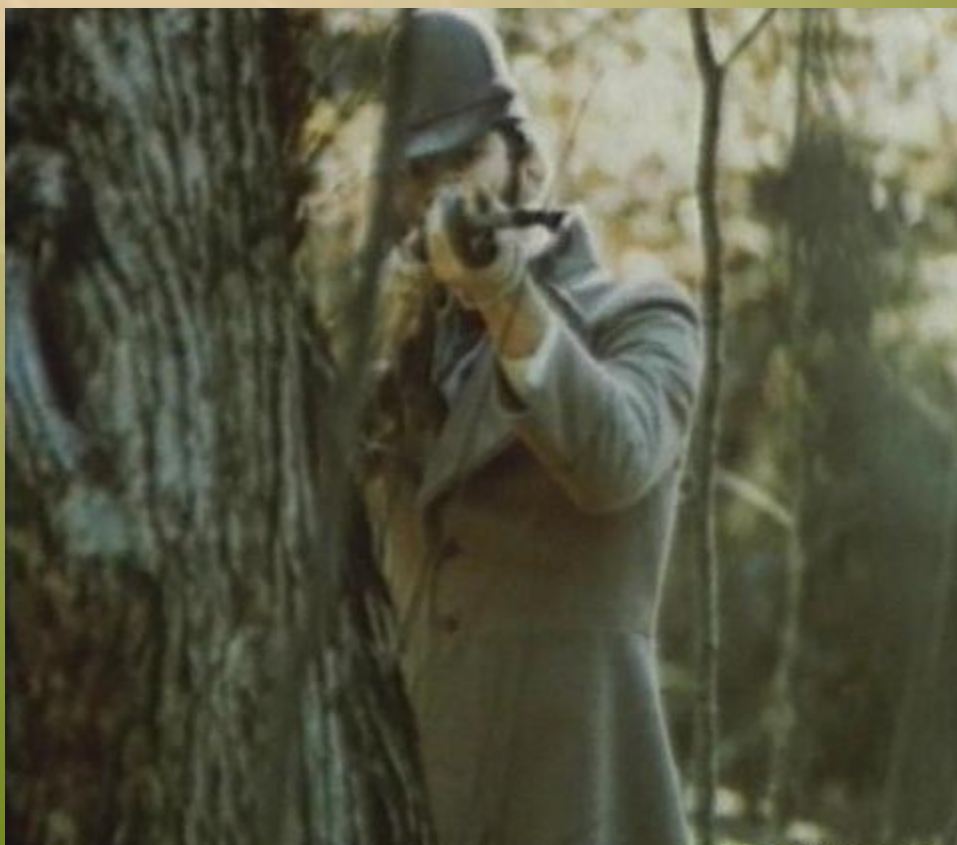
Герой- рассказчик (барин)