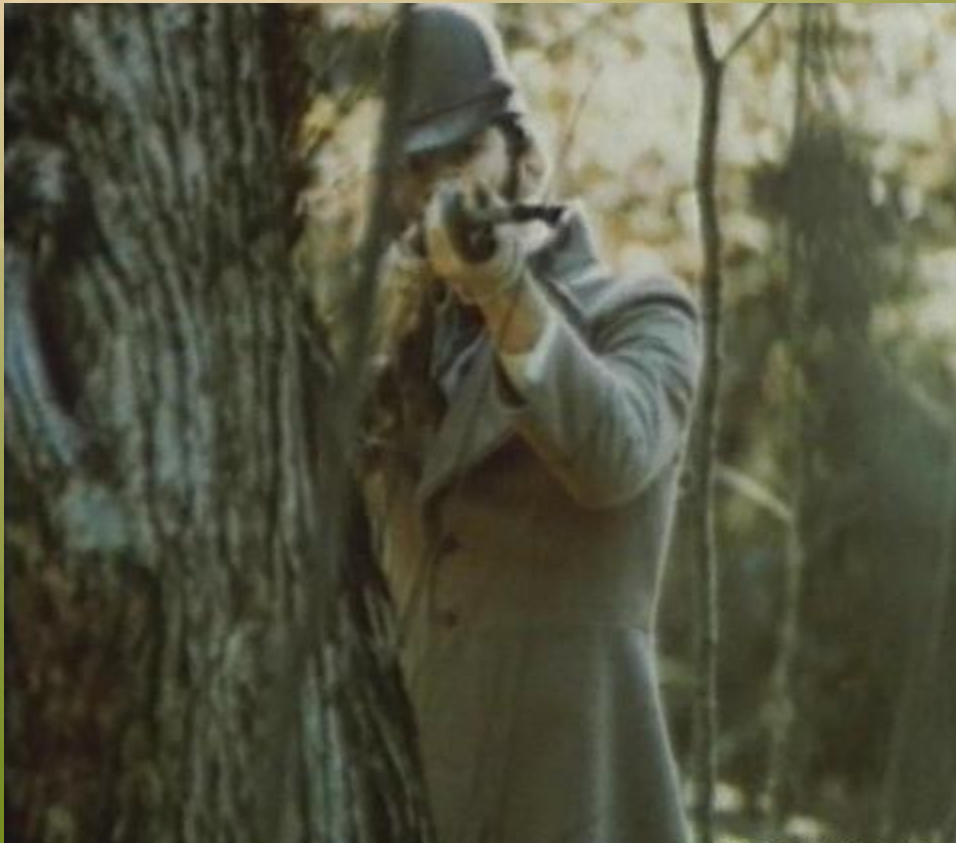
Герой- рассказчик (барин)