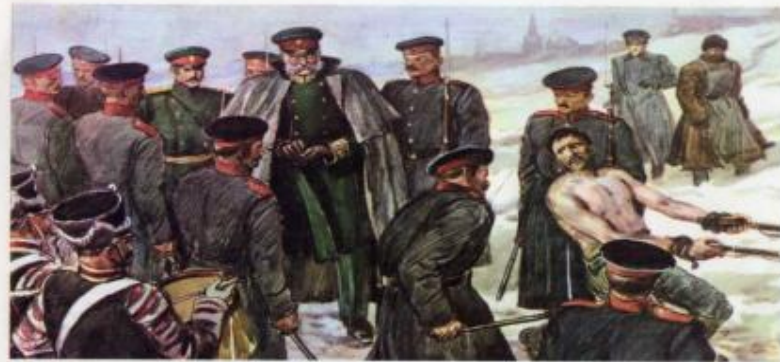
41. Савозь строй. Художник Н. Н. Пospelов