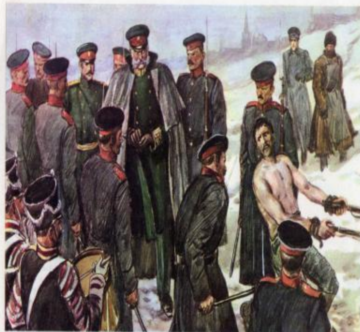
41. Сквозь строй Художник Н. И. Пчелко

4) За что наказывали солдата? а) за грубость полковнику; б) за трусость; в) за побег; г) за кражу казённого имущества.