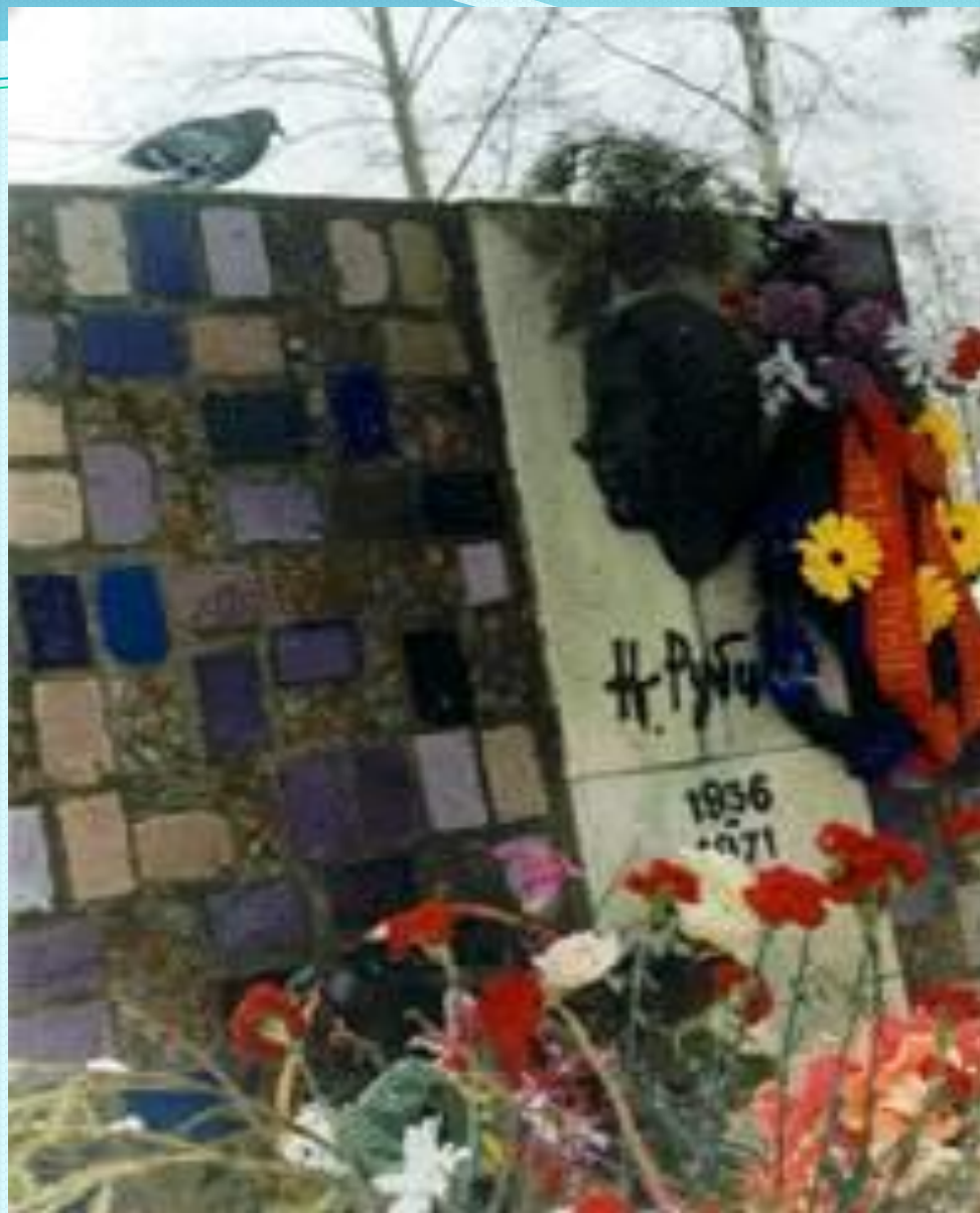
Могила Н. Рубцова