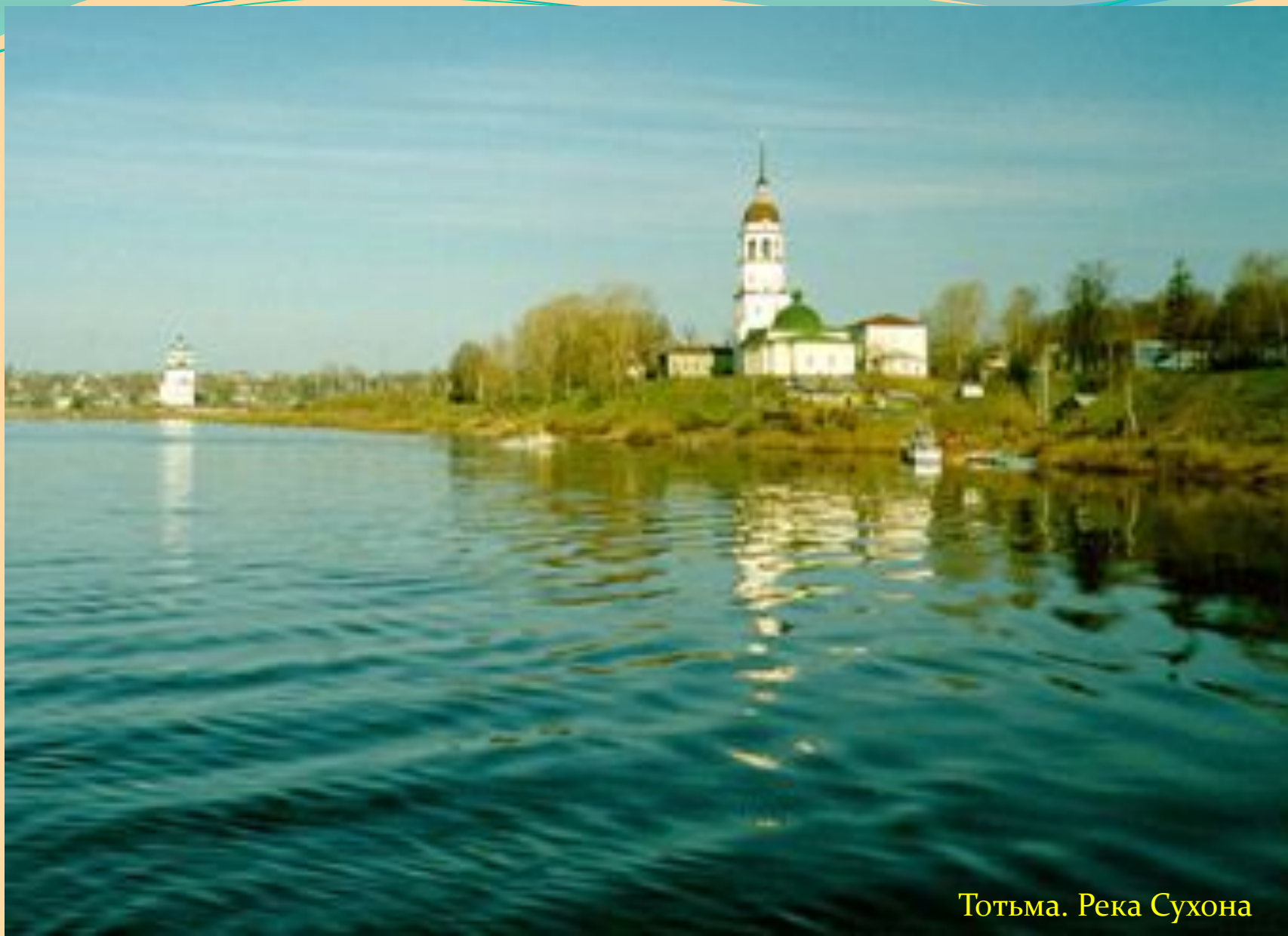
Тотьма. Река Сухона