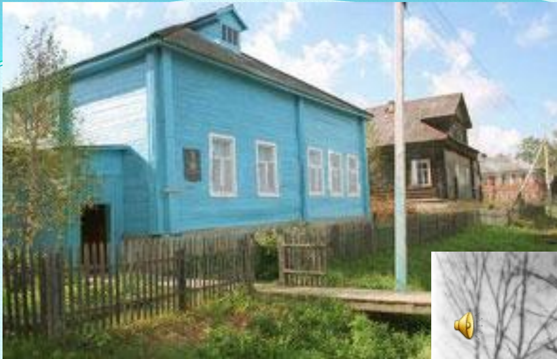
Музей Н. М. Рубцова в Никольско