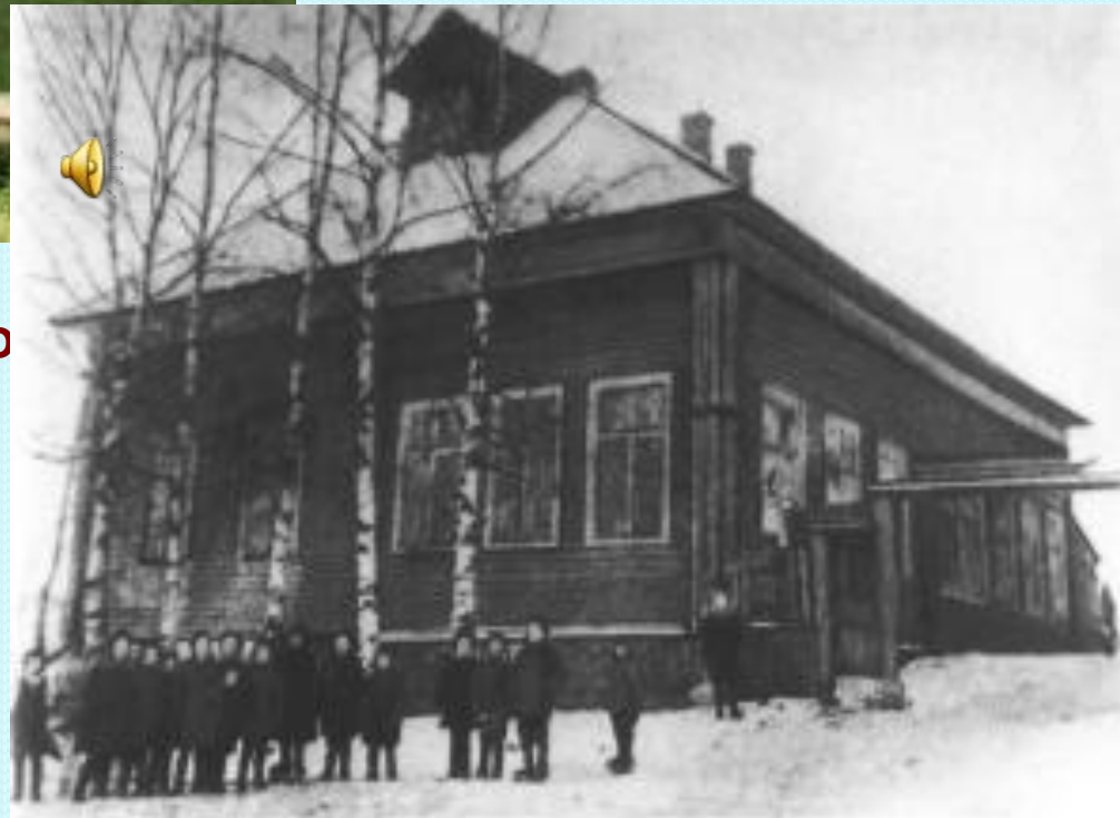
Детский дом в с.Никольское, где в 1943-1950 гг. жил Н. Рубцов