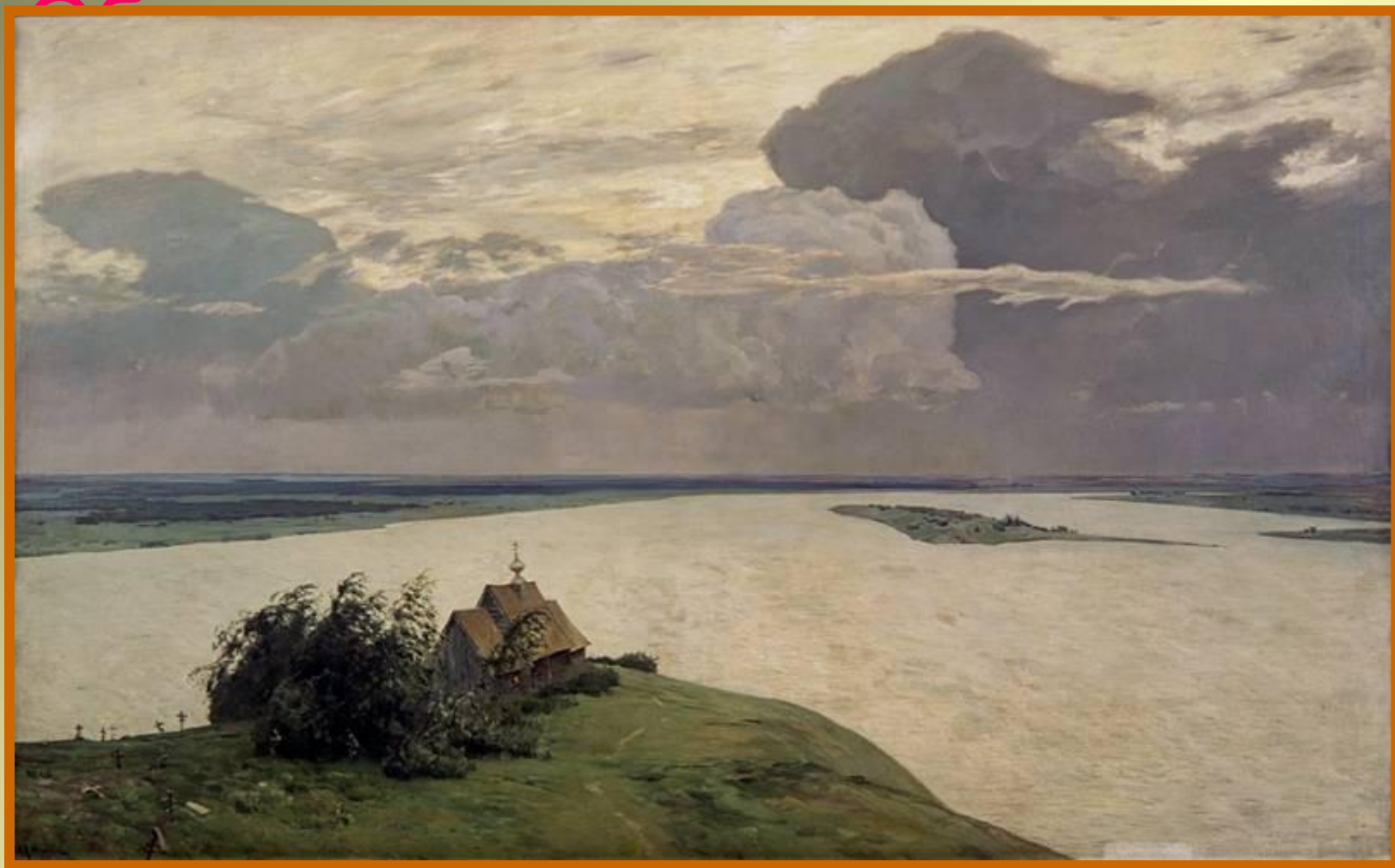
Над вечным покоем. И.И.Левитан.