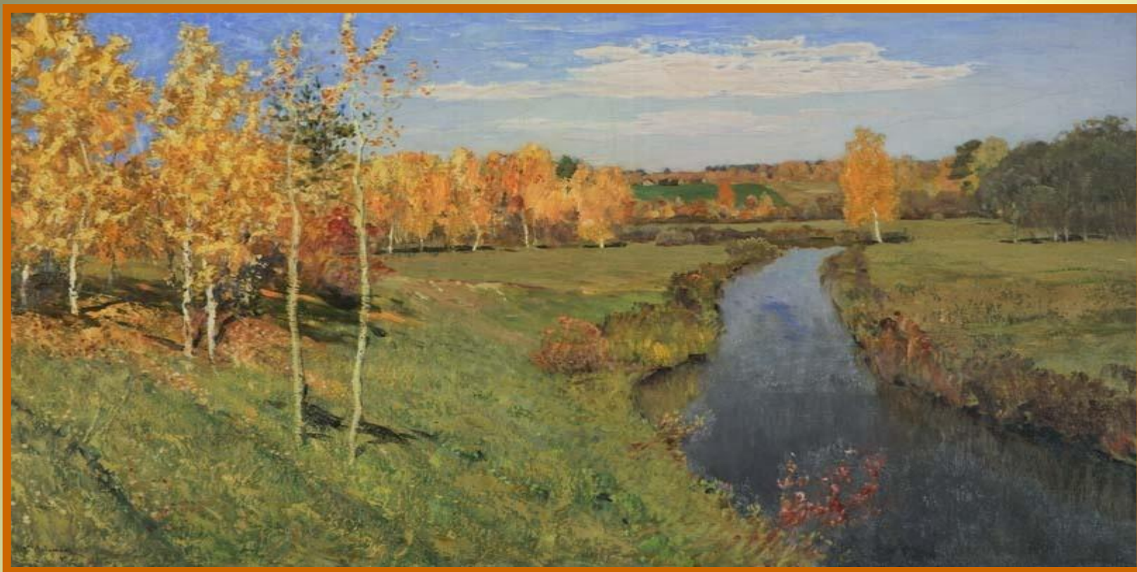
Золотая осень. И.И.Левитан.