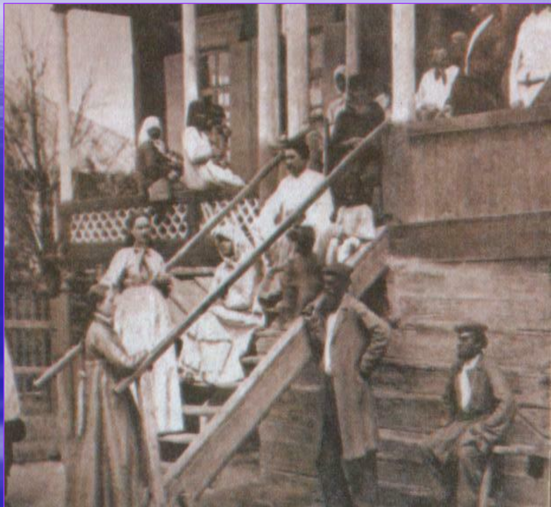
Семья богатого казака в праздник. Конец XIX в.

Один из самых светлых и красочных праздников – Пасха, центральное событие в духовной жизни каждого христианина. Последнее воскресенье перед Пасхой называется вербным. Неделя перед Пасхой – страстная, посвящена воспоминаниям о страданиях Христа. На Дону казаки, как и все православные, праздновали Пасху.