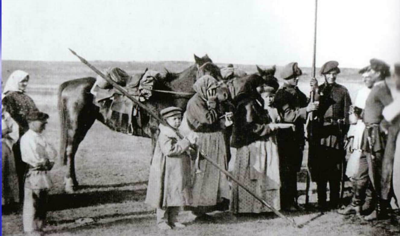
Проводы казаков на службу. Фото Болдырева И.В., 1876г., сентябрь.

Проводы казаков на службу являлись целым событием. Торжественно и тщательно готовились к встрече служивых. Погуляв и отдохнув недельку казак принимался за работу.