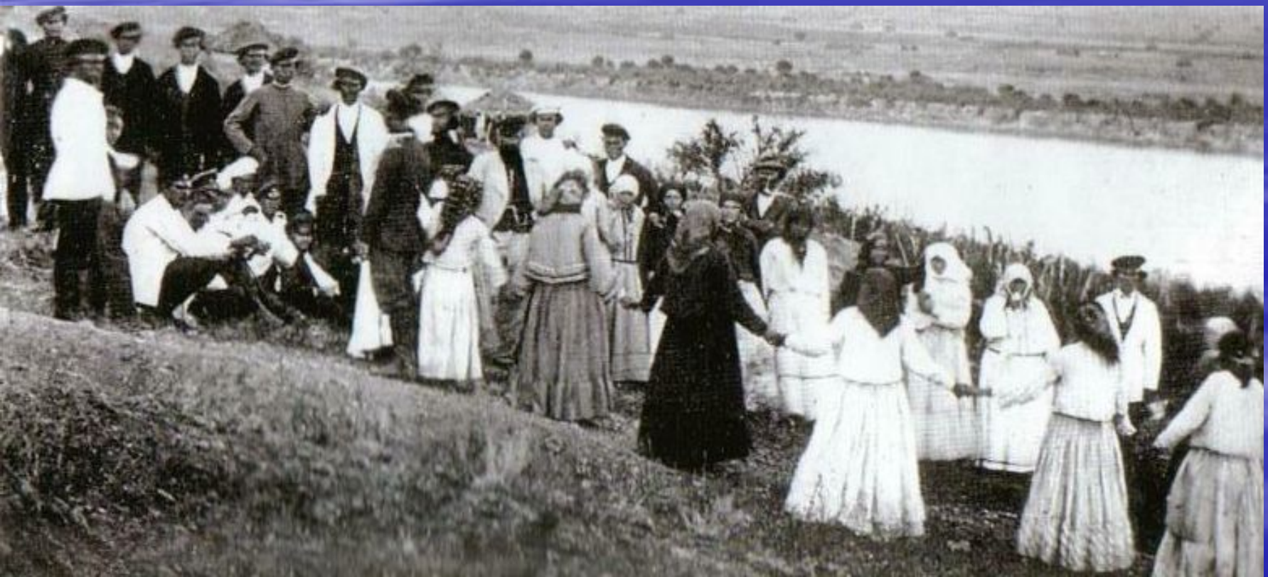
Улица в праздник на виноградных садах. Фото Бондырева И.В., 1876г.

«По вечерам в топотном звоне стонали улицы, игрища всплескивались в песнях, в пляске под гармошку, и лишь поздней ночью догорали в теплой сухмени последние на окраинах песни» (т. I, ч. III, гл. I).