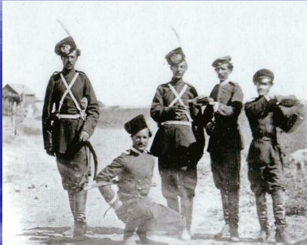
Казачья служба перед выходом на службу. 1876г.

Казачья служба по закону с 1875г. продолжалась 20 лет, начиная с 18-летнего возраста: 3 года в подготовительном разряде, 4 года на действительной службе, 8 лет на льготе и 5 лет в запасе.