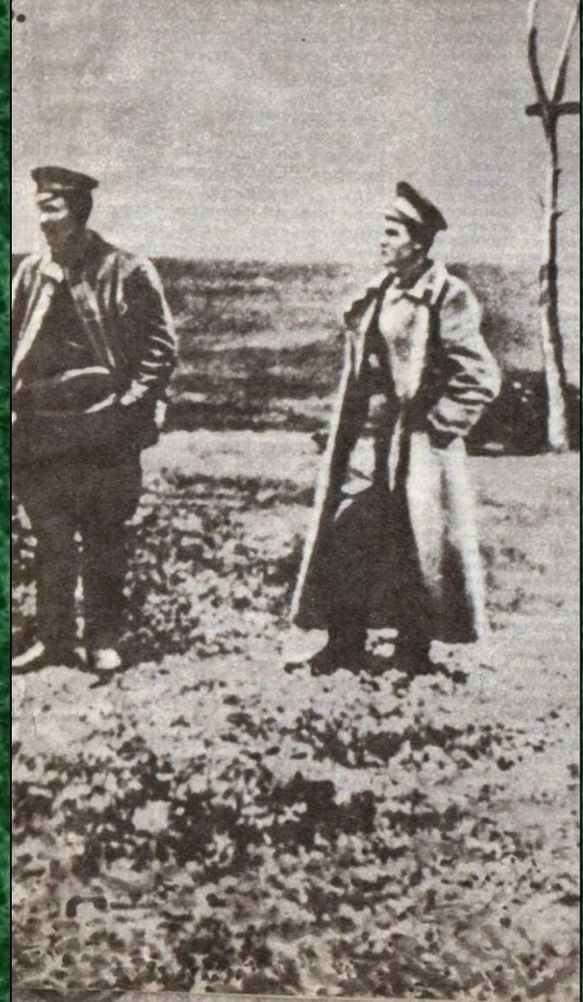
Ф. Г. Подтелков и М. В. Кривошлыков перед казнью 11 мая 1918 года в хуторе Пономареве.

Подтелков и Кривошлыков возглавили специальную комиссию, которая 1 мая 1918 под охраной отряда (120 чел.) выехала в районы верхнего Дона в целях проведения мобилизации в Красную Армию. 10 мая отряд был захвачен в плен белоказаками, а 11 мая П. был повешен вместе с комиссаром М. В. Кривошлыковым. Об этой казни очень подробно рассказывается в романе М. А. Шолохова «Тихий Дон».