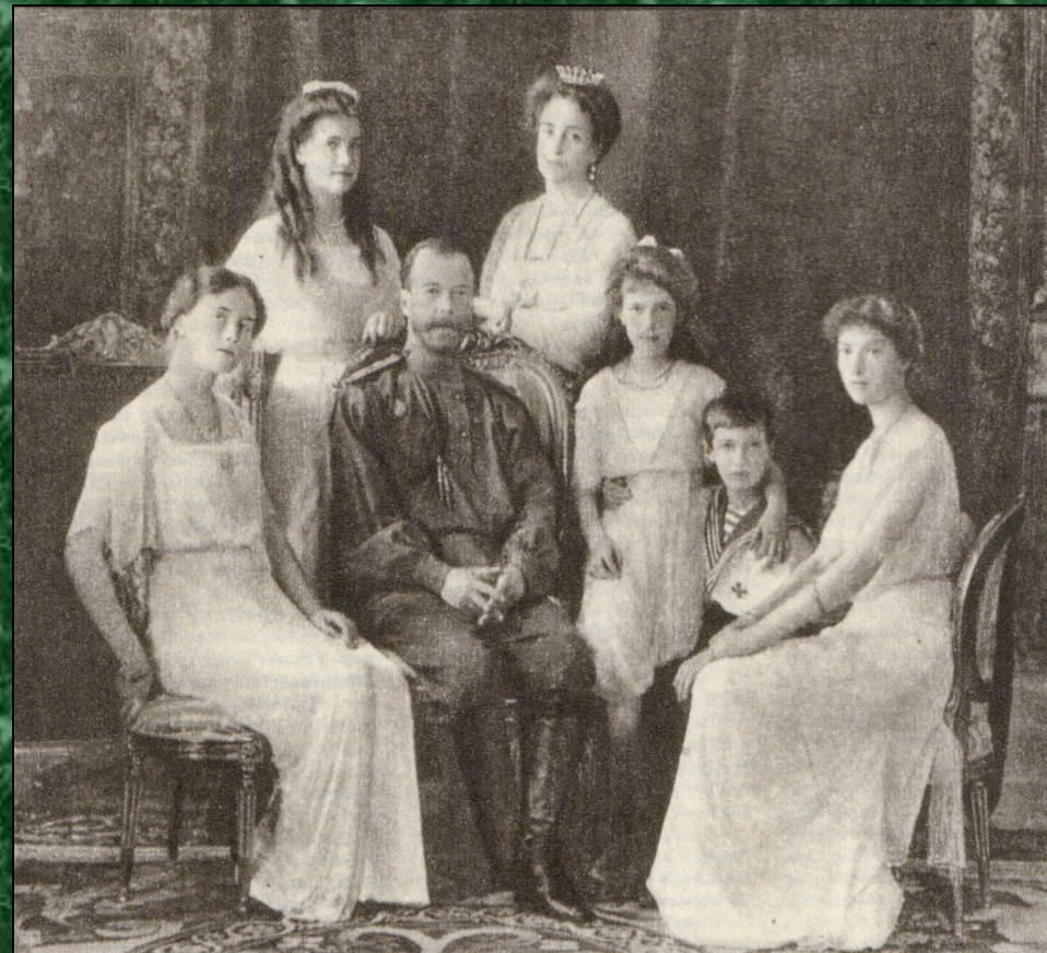
Император Николай II вместе с семьей

17 июля 1918г. Императорская семья была расстреляна в Екатеринбурге.