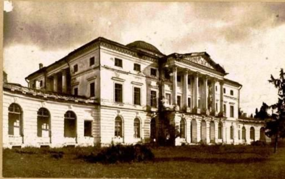
Имение Красный Рог