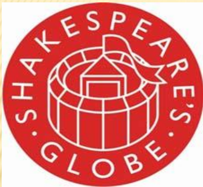
ЭМБЛЕМА СОВРЕМЕННОГО ТЕАТРА «ГЛОБУС»