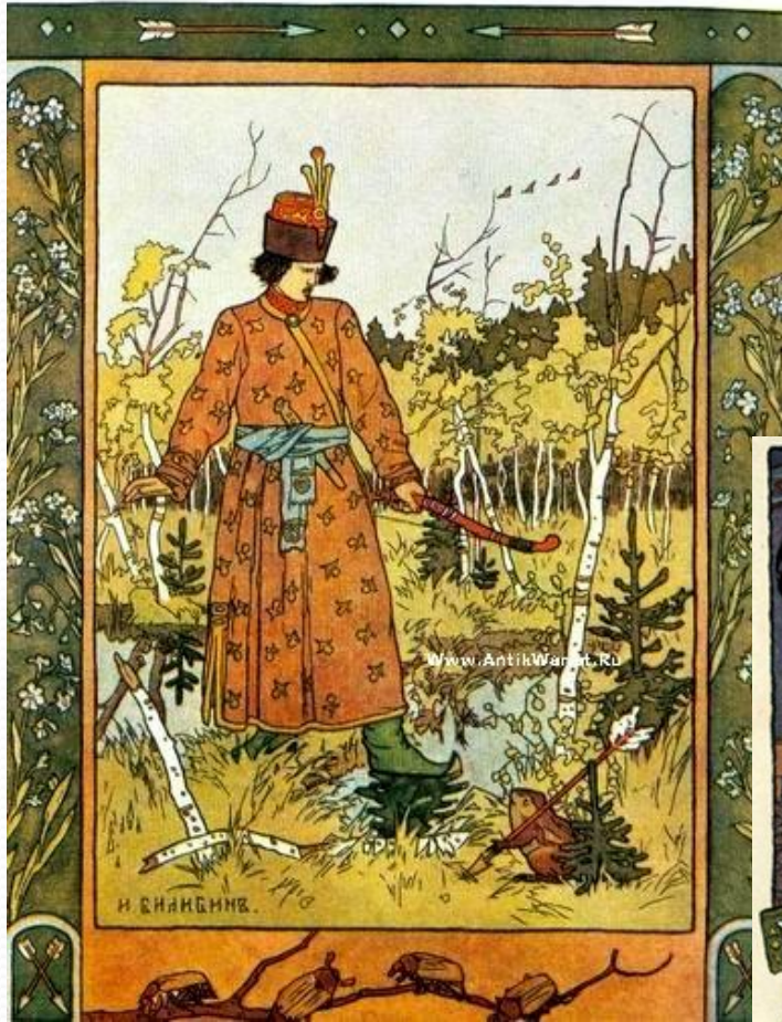
Иллюстрация к сказке «Царевна-лягушка».