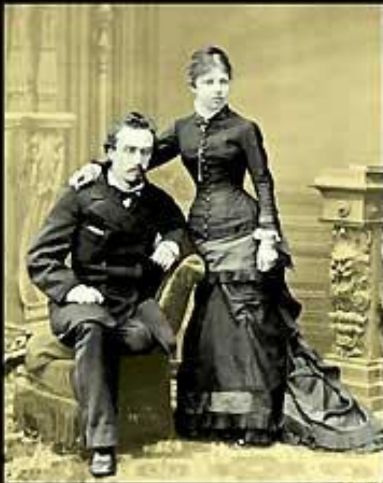
Родители А. А. Блока