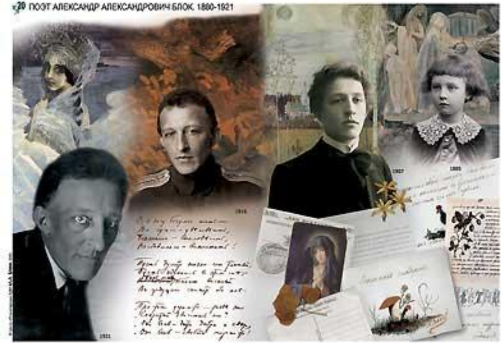
«20 ПОЭТ АЛЕКСАНДР АЛЕКСАНДРОВИЧ БЛОК. 1860-1921

Стоит передо мной моя тема, тема о России...Этой теме я сознательно и бесповоротно посвящаю жизнь.