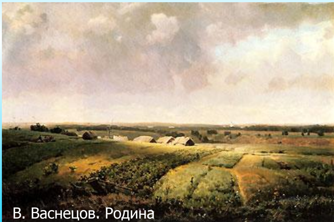
В. Васнецов. Родина