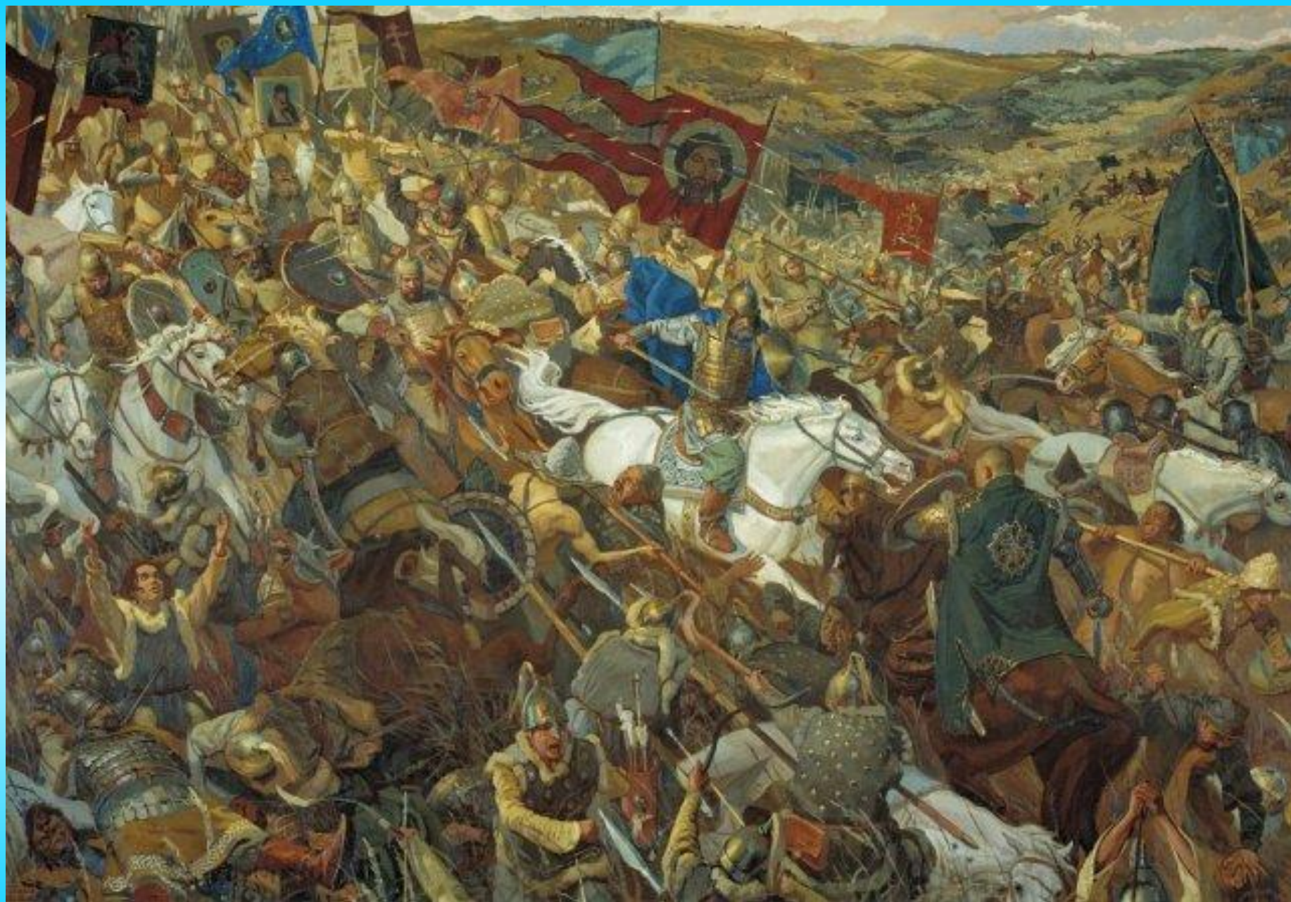
В. Маторин. Удар засадного полка