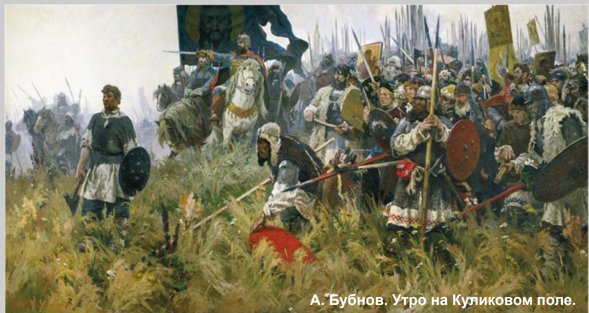
А. Бубнов. Утро на Куликовом поле.

«Куликовская битва принадлежит... к символическим событиям русской истории. Таким событиям суждено возвращение. Разгадка их еще впереди». (А. Блок)