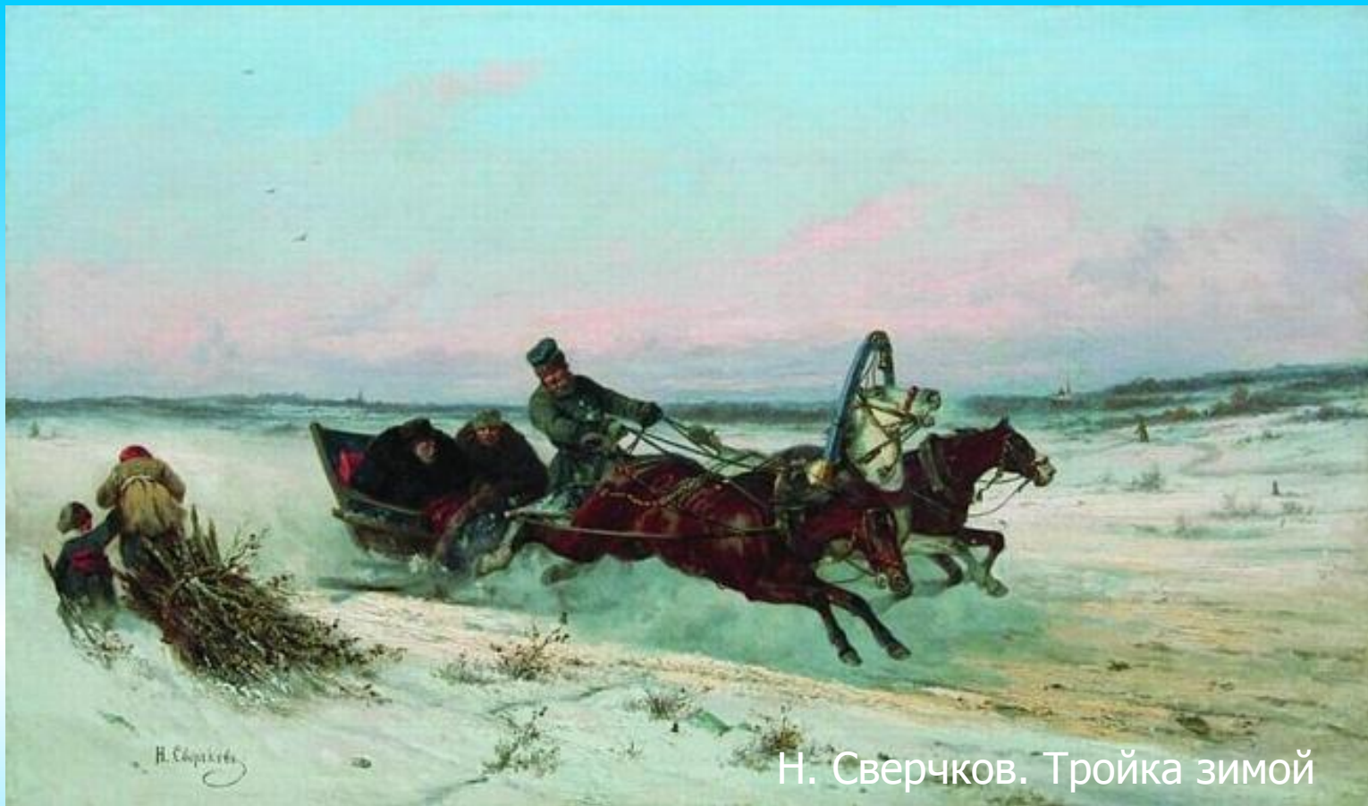
Н. Сверчков. Тройка зимой

«И вот поднимается тихий занавес наших сомнений, противоречий, падений, безумств: слышите ли вы задыхающийся гон тройки? Видите ли вы ее, ныряющую по сугробам мертвой и пустынной рывины? Это – Россия летит неведомо куда – в сине-голубую пропасть времен... Видите ли вы ее звездные очи – с мольбою, обращенною к нам: «Полюби меня, полюби красоту мою!» Но нас от нее отделяет эта бесконечная даль времен, эта синяя морозная мгла, эта снежная звездная сеть» (Из дневника А. А. Блока, 1908 год)