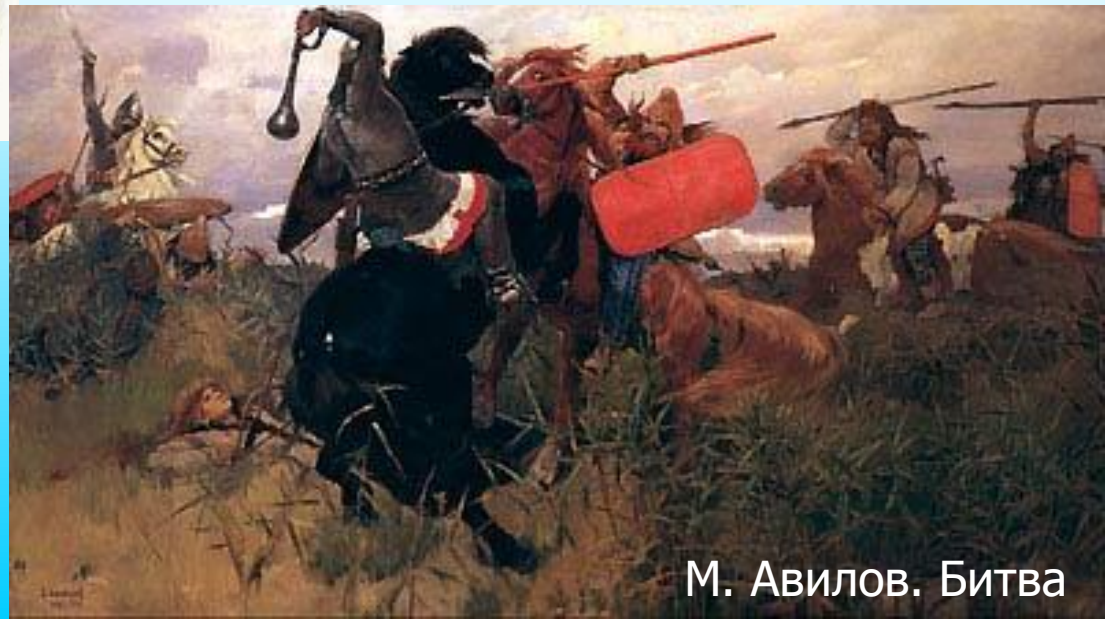
М. Авилов. Битва