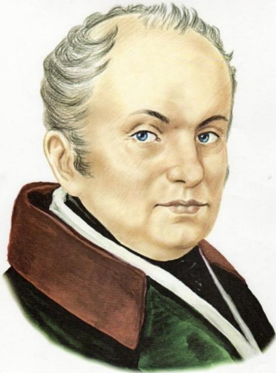
Жуковский Василий Андреевич (1783-1852)

портрет В.Жуковського, за продаж якого Шевченко був викуплений з неволі і який був колись у Третьяковській галереї, тепер зберігається у Національному музеї Т. Шевченка, що у Києві; його вважають оригінальним твором Карла Брюллова;