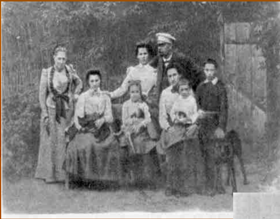
Семья Цветаевых во дворе дома в Трехпрудном. Стоят : Андрей, Иван Владимирович, Ольга Иловайская; сидят: Марина Александровна с дочерью Анастасией, Марина, Валерия.