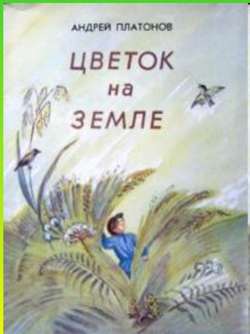
Платонов А.П. «Цветок на земле»