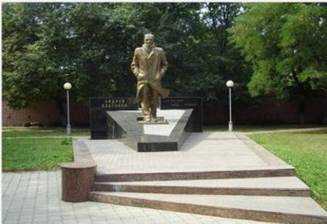
Памятник уроженцу Воронежа писателю Андрею Платоновичу Платонову