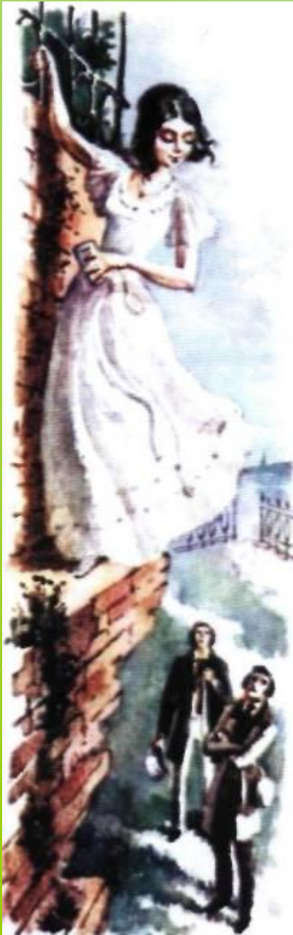
Иллюстрация В.М.Зельдес к повести И. С. Тургенева «Ася». 1982