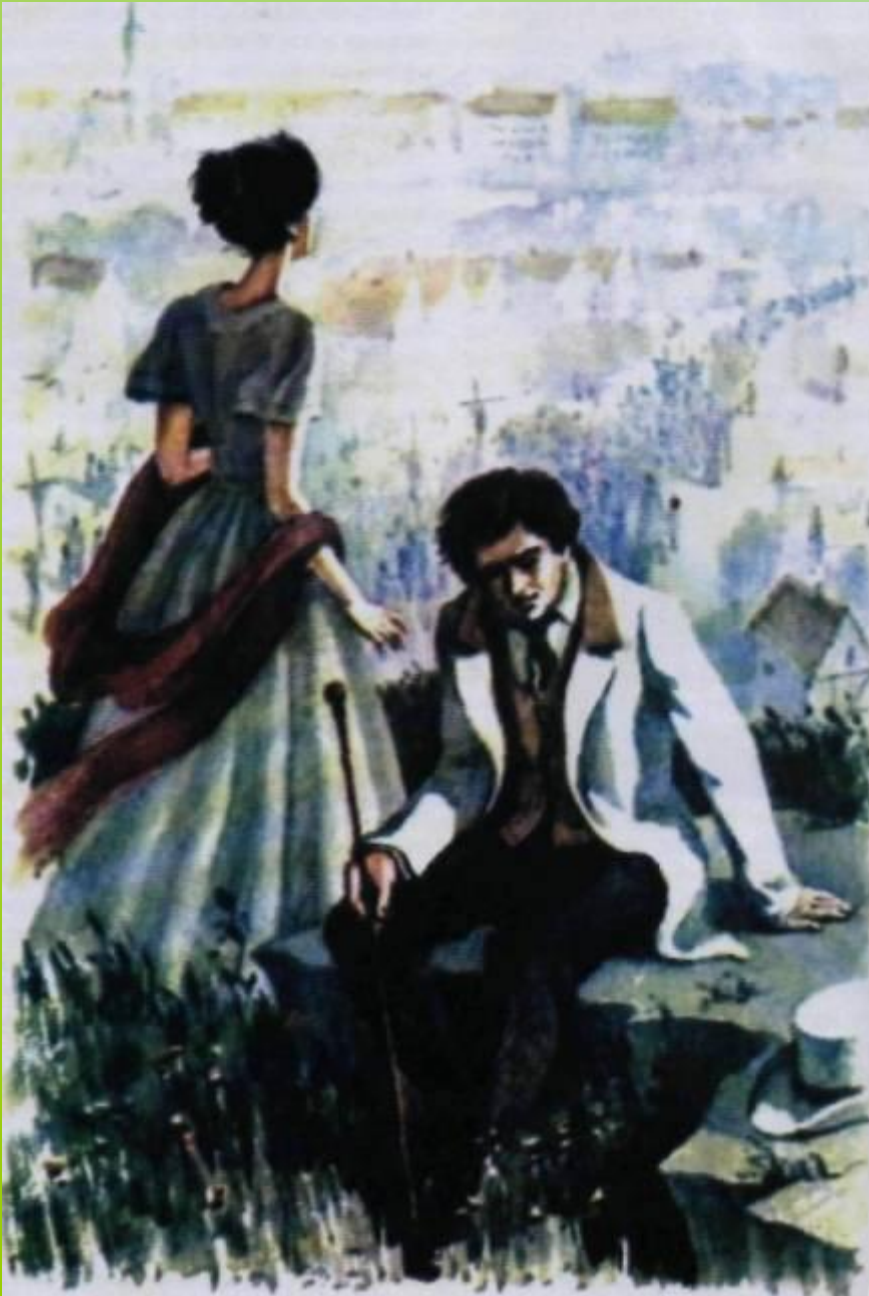
Иллюстрация В.М.Зельдес к повести И. С. Тургенева «Ася». 1982