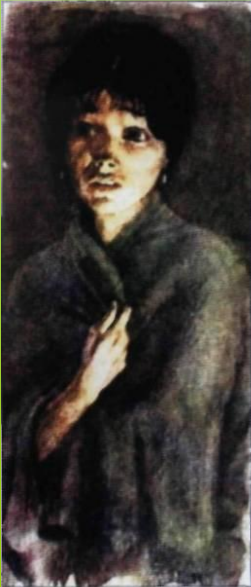
Иллюстрация В.М.Зельдес к повести И. С. Тургенева «Ася». 1982