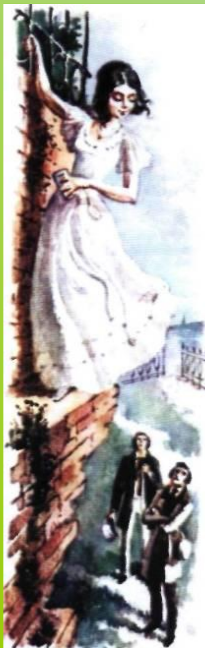
Иллюстрация В.М.Зельдес к повести И. С. Тургенева «Ася». 1982