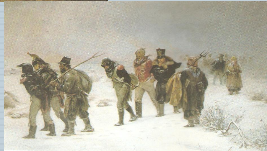
И. М. Прянишников. В 1812