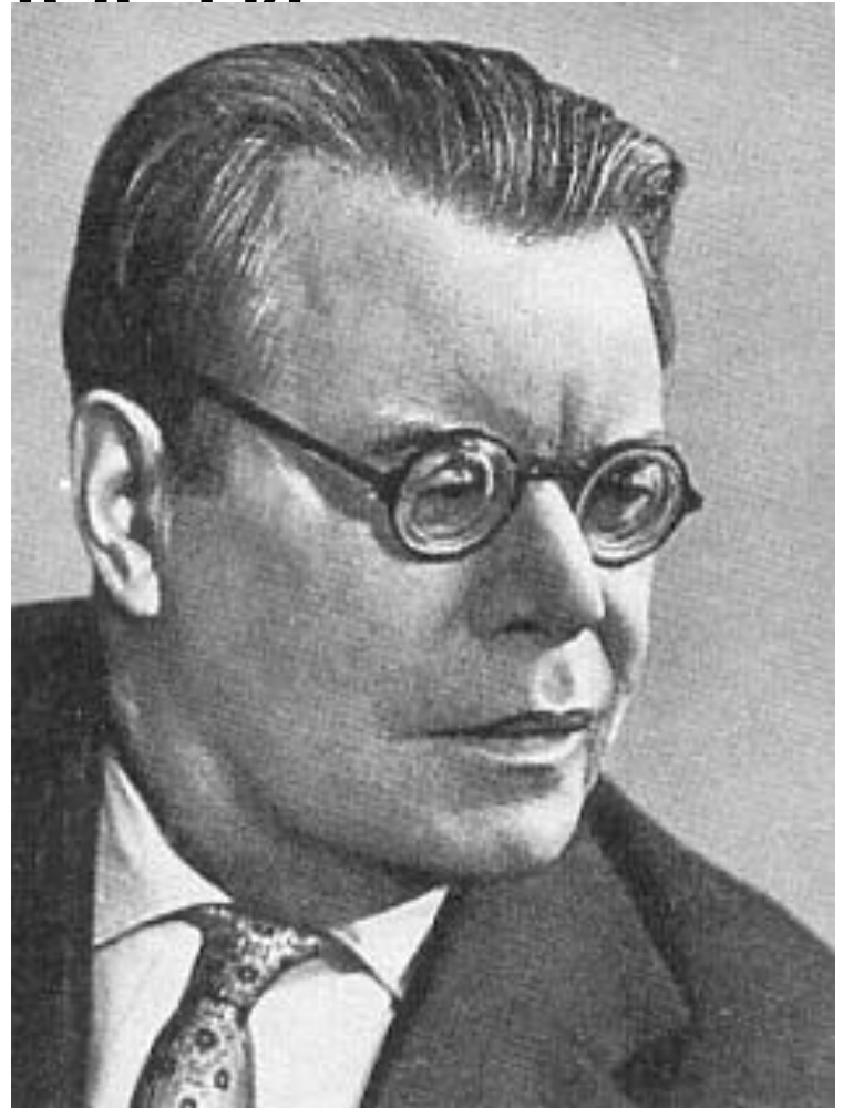
Михаил Васильевич Исаковский

Однажды, собрав несколько стихотворений, Твардовский принёс их Михаилу Исаковскому, работавшему в редакции газеты «Рабочий путь». Исаковский встретил поэта приветливо, став другом и наставником молодого