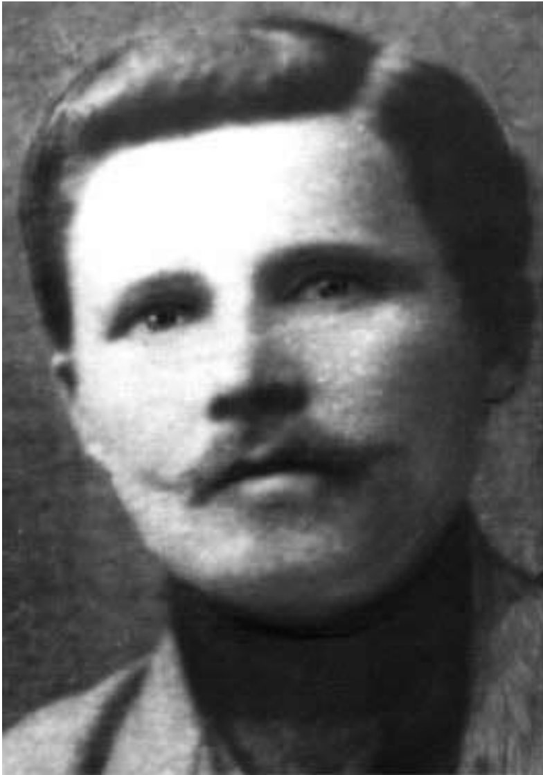
Трифон Гордеевич Твардовский

Александр Трифонович Твардовский родился 8 июня 1910 года на хуторе Загорье в Смоленской области в семье деревенского кузнеца Трифона Гордеевича Твардовского. В годы войны этот хутор был сожжен немецкими войсками.