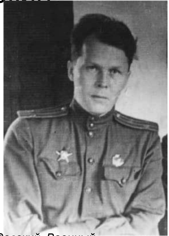
Твардовский- Военный корреспондент

После окончания в 1939г. Московского института философии, литературы и истории (ИФЛИ) Твардовский был призван в армию как военный корреспондент. Трудности, испытанные Красной Армией в зимнюю кампанию 1939/40гг. Подготовили поэта к трагедиям Великой Отечественной войны.