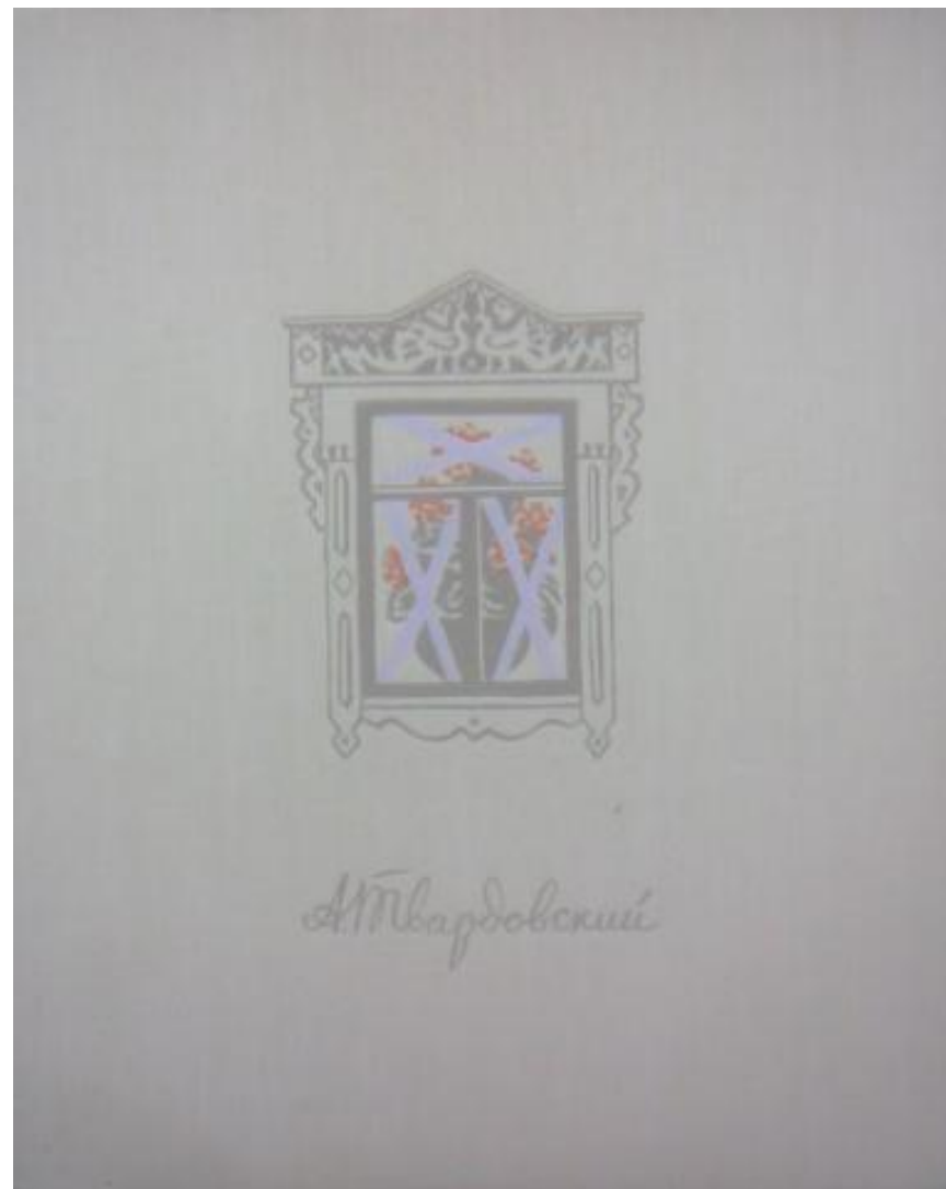
Дом у дороги. 1946 год.

В 1945 году была завершена работа над «Теркиным». Книга тут же издается и пользуется небывалой популярностью. В следующем году Александр Трифонович получил Государственную премию за «Василия Теркина». В этом же году написана поэма «Дом у дороги» – тоже о войне, но с трагической точки зрения. Как писал Самуил Маршак, «поэма могла родиться только в годы великого народного бедствия, обнажившего жизнь до самого основания». За эту поэму в 1947 году Твардовский так же получил Государственную премию