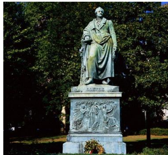
Памятник Гёте И.В. в г.Фракфурт