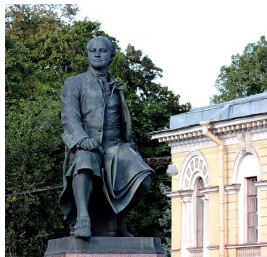
Памятник Ломоносову М.В. в г. Сочи