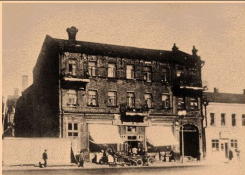
Дом на Первой Мещанской, где в 1938 г. родился Владимир Высоцкий. Снесён в 1955 г.

Когда началась Великая Отечественная война, он два года жил в эвакуации вместе с матерью в городе Бузулук, что на Урале. Уже в 1943 году он возвратился в Москву, все на ту же на 1-ю Мещанскую улицу в дом № 126.